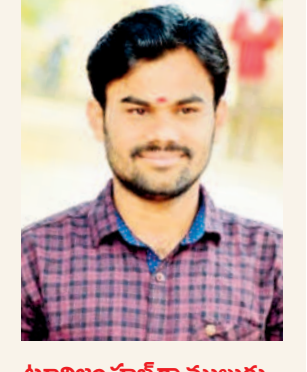
టూరిజం హాటింగ్ ములుగు