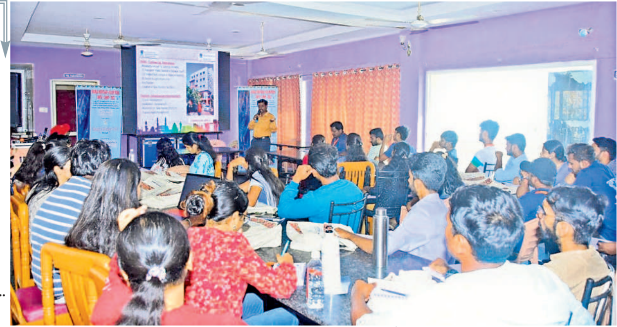
క్యాంపెయిన్ లో వలంటీర్లు