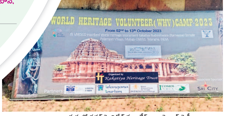
రామప్పలో వరల్డ్ హరిటేజ్ వలంటీర్స్ క్యాంపెయిన్ ఫైట్

మాతృత్వ సాంకేతిక పరిజ్ఞాని అందించుకునేలా ఎన్నికల కమిషన్ ఆన్లైన్లోనూ అభ్యర్థులు నామినేషన్లు సమర్పించేలా ఏర్పాటు చేసింది. ఈ మేరకు సువిధ యాప్ ను అందుబాటులోకి తీసుకొచ్చింది. యాప్ లో అన్ని వివరాలను నమోదు చేసి, నిర్జిత సమయంలో స్లాట్ బుకింగ్ చేసుకోవాలి. చివరి రోజు నేరుగా మూడు సెట్ల పత్రాలు అందిస్తేనే నామినేషన్ దాఖలు చేసినట్లు భావిస్తారు. - ములుగు శోనీ, అక్టోబర్ 12