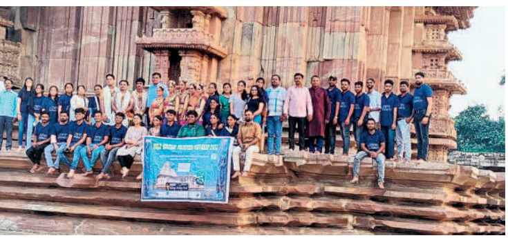
రామప్పలో వరల్డ్ హరిటేజ్ వలంటీర్స్ క్యాంపెయిన్ ఫైట్

వెంకటాపూర్, అక్టోబర్ 12 : రామప్ప ఆలయ ఖ్యాతిని విశ్వవ్యాప్తం చేసేందుకు ఇక్కడ 11 రోజులుగా 'వరల్డ్ హరిటేజ్ వలంటీర్స్ క్యాంపెయిన్'ను 'వర్లంగ్ ఆన్ ద ప్యూచర్' అనే థీమ్ తో నిర్వహించారు. రాష్ట్ర పర్యాటక శాఖ, ఐకోమస్ ఇండియా, కేంద్ర పురావస్తు శాఖ, ఇంటాక్ సంస్థల సహకారంతో కాకతీయ హరిటేజ్ ట్రస్ట్ ఆధ్వర్యంలో కొనసాగింది. 33 దేశాల్లో 74 క్యాంపెయిన్ ఏర్పాటు చేయగా, దేశవ్యాప్తంగా పది చోట్ల నిర్వహిస్తున్నారు. కొత్తగా ఎంపికైన వారసత్వ కట్టడాల గురించి ఆన్లైన్లో చరిత్ర, ఆర్కియోలాజీ, సివిల్ ఇంజనీరింగ్, టూరిజం, ఆర్కియాలజీ విద్యార్థులను దరఖాస్తులను ఆప్టనించి ఎంపికైన వలంటీర్లకు శిక్షణ ఇచ్చారు. ఆయా ప్రదేశాల చరిత్ర, ప్రత్యేకతలు, నిర్మాణశైలి, అప్పటి టెక్నాలజీ, సంస్కృతి, కళలు, గొప్పతనం, సంరక్షణ చర్యలు, స్థానిక జీవన విధానం, సంప్రదాయాల గురించి వివరించి వారితో తమ తమ ప్రదేశాల్లో ప్రచారం చేయిస్తారు. ఈ క్యాంపెయిన్ ప్రపంచ వ్యాప్తంగా ఏప్రిల్ నుంచి డిసెంబర్ వరకు నిర్వహిస్తున్నారు. మన దేశంలో రామప్పలో నిర్వహించే క్యాంపెయిన్ వివరించి, నివేదికను నవంబర్ 15 వరకు యునెస్కోకు సమర్పించును. ఈ సారి 260 మంది దరఖాస్తు చేసుకోగా 40 మంది ఎంపికయ్యారు. 14 రాష్ట్రాలకు చెందిన 35 మంది వలంటీర్లు హాజరయ్యారు.