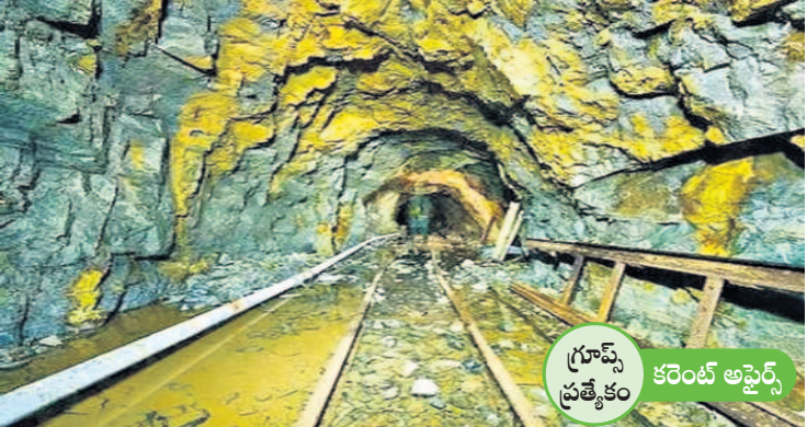
గ్రూప్స్ ప్రత్యేకం కరెంట్ అఫైర్స్