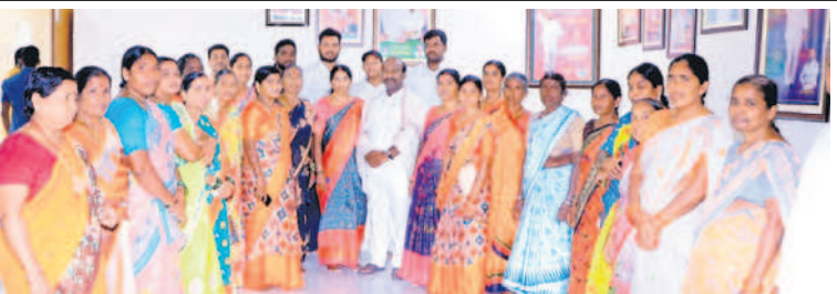
ఎమ్మెల్యే చిరుమర్తికి మద్దతు తెలుపుతున్న ఇంద్రవాలనగరం మహిళలు