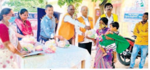
పాష్టికాహార కిట్ల పంపిణీ చేస్తున్న క్షణ సభ్యులు