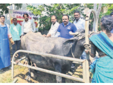
పశువైద్య శిబిరంలో పాల్గొన్న వైద్యాధికారులు

చౌటుప్పల రూరల్, అక్టోబర్ 12 : మండలంలోని స్వాములవారి లింగోటం గ్రామంలో పశుగణాభివృద్ధి సంస్థ ఆధ్వర్యంలో గురువారం గర్భకోశ వ్యాధి చికిత్స శిబిరం నిర్వహించారు. ఈ సందర్భంగా రైతులకు ఆయన పశువుల పెంపకంపై పలు సూచనలు చేశారు. పశువులకు వ్యాధులు రాకుండా టీకాలు వేయించాలని తెలిపారు. శిబిరంలో 35 పశువులకు గర్భకోశ వ్యాధి చికిత్సలు, 150 పశువులకు గాలికుంటు వ్యాధి టీకాలు వేశారు. కార్యక్రమంలో ఉమ్మడి నల్లగొండ జిల్లా ఈడీ పాశం శ్రీని