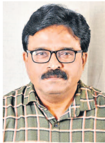
ఎంపీ శ్రీనివాసన్ చరిత్ర పరిశోధకుడు

2014 వరకూ తీరు మారని తెలంగాణ కాంగ్రెస్ నేతలు ఎప్పుడు ఉద్యమం వచ్చినా ఆంధ్ర సీఎలకే ఊడిగం