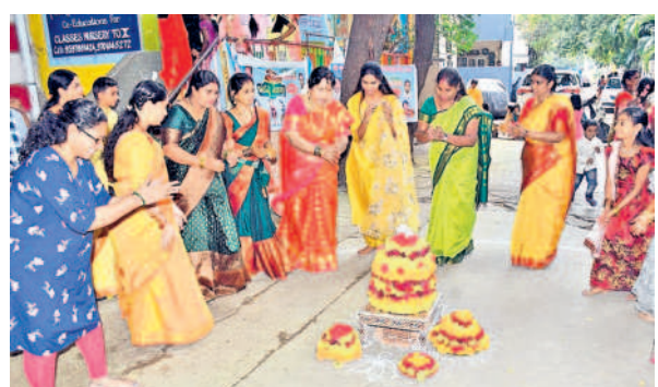
విద్యార్థులతో కలిసి బతుకమ్మ ఆడుతున్న కార్పొరేటర్లు శైలజ,హేమ తదితరులు

Advocate CHAMBER OF LAWYERS' COLLECTIVE Plot No. 80/B, H.No. 11-13-177/1, Road No. 3, Green Hills Colony, othapet, Hyd.-35, Cell No.9989286688