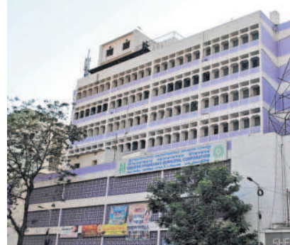
జీహెచ్ఎస్ఐ భవనం, అబిడ్స్