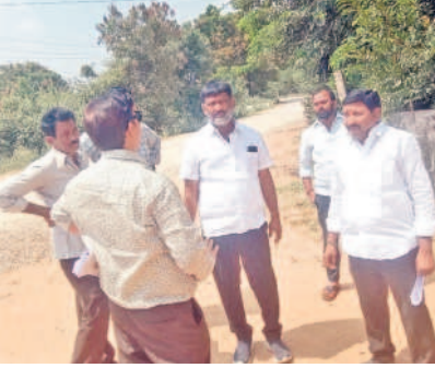
రైల్వే బ్రిడ్జి నిర్మాణం చేసే స్థలాన్ని పరిశీలిస్తున్న రైల్వే అధికారులు, స్థానిక నాయకులు