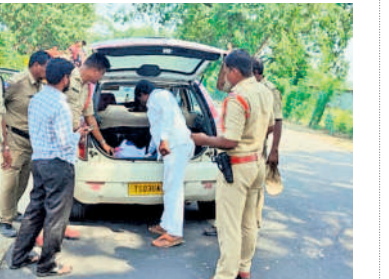
జనగామలో వాహనాలను తనిఖీ చేస్తున్న పోలీసులు