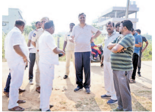
ఏర్పాట్లను పరిశీలిస్తున్న ఎమ్మెల్యే, జనగామ అభ్యర్థి వల్లా