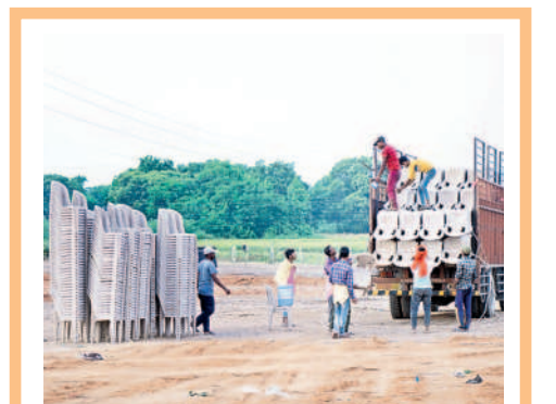
వాహనాలకు ప్రెస్టన్ మైదానం, సూర్యాపేట వైపు నుంచి వచ్చే వాహనాలకు బతుకమ్మకుంట, ఎన్ఎంఆర్ గార్డెన్ ప్రాంతాల్లో పార్కింగ్ ఏర్పాట్లను పరిశీలించాలని బీఆర్ఎస్ నాయకులు షోలీసులను కోరారు. హెలిప్యాడ్ కోసం వికాసనగర్లో బీఆర్ఎస్ సభావేదిక సభ జరిగిన స్థలాన్ని ఖరారు చేసి ఇప్పటికే నిర్మాణ పనులను ప్రారంభించారు. ఎండవేడిమి ఎక్కువగా ఉంటున్న దృష్ట్యా ప్రత్యేక బారేకెట్లు, షామియానాలు, పెద్ద ఎత్తున ఫ్యాన్లు, కూలర్లు ఏర్పాటు చేయాలని నిర్ణయించారు. బహిరంగ సభ, సీఎం సభాస్థలి, హెలిప్యాడ్ వద్ద బండ్ల బస్సు వంటి ఏర్పాట్లపై షోలీసులను కనరత్న చేస్తున్నది. అదినేత సభను విజయవంతం చేసేందుకు బీఆర్ఎస్ జిల్లా శ్రేణులు ఇప్పటికే రంగంలోకి దిగాయి. సభావేదిక మహిళాను నిర్వహిస్తూ, భారీగా జన సమీకరణ చేసేందుకు దిశానిర్దేశం చేస్తున్నాయి.