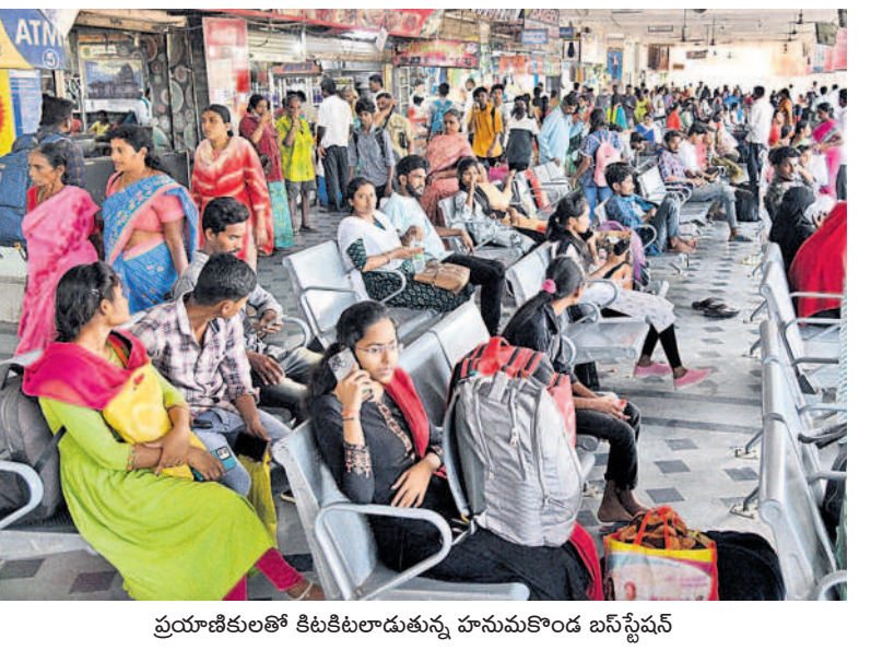
ప్రయాణికులతో కిటికీలాడుతున్న హనుమకొండ బస్ స్టేషన్