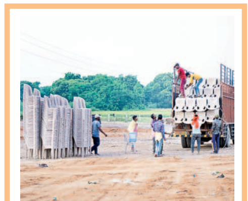
జనగామలో సీఎం కేసీఆర్ సభ కోసం ముమ్మరంగా జరుగుతున్న ఏర్పాట్లు