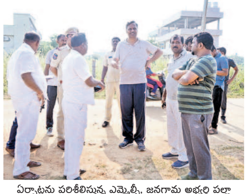
ఏర్పాట్లను పరిశీలిస్తున్న ఎమ్మెల్యే, జనగామ అభ్యర్థి వల్లా