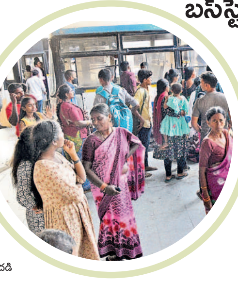
హనుమకొండ బస్ స్టేషన్లో ప్రయాణికుల సందడి