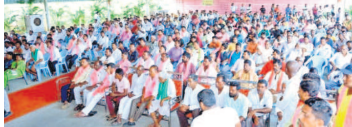
కరీంనగర్ ధారల్: గోపాల్ పూర్ సమావేశానికి హాజరైన ప్రజలు