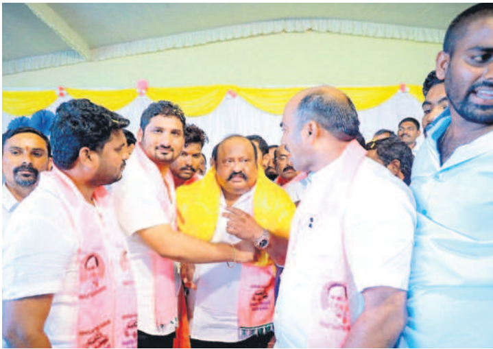
కరీంనగర్ ధారల్: గోపాల్ పూర్ లో మంత్రి గంగులను సన్మానిస్తున్న జిఆర్ఎస్ లో చేరిన నాయకులు

కరీంనగర్, అక్టోబర్ 13 (నమస్తే తెలంగాణ) : అసెంబ్లీ ఎన్నికల ప్రచారంలో ఆధికార బీఆర్ఎస్ ఎప్పుడూ ముందు వరుసలోనే ఉంటోంది. ఎన్నికలు జరిగిన ప్రతీసారి వ్యూహాత్మకంగా వ్యవహరిస్తూ అభ్యర్థులను ముందే ప్రకటించి విస్తృత ప్రచారానికి శ్రీకారం చుట్టింది. కాంగ్రెస్, బీజేపీ నుంచి ఇంకా అభ్యర్థులు ఎవరనేది ఖరారు కాకముందే బీఆర్ఎస్ అభ్యర్థులు కార్యక్రమాలతో సమావేశాలు, ముఖ్యాధ్యక్షులతో మంతనాలు, ప్రచార వ్యూహాలను సిద్ధం చేసుకుని ప్రజల్లోకి వెళ్తున్నారు. కాంగ్రెస్, బీజేపీ నుంచి ఎవరు ఎక్కడి నుంచి పోటీలో ఉంటారనేది ఇప్పటి వరకు స్పష్టం లేదు. ఆ పార్టీలో ఆంధ్రకంఠ కుమ్మలాటలు అభ్యర్థుల ఎంపికకు ఆటంకాలుగా మారాయి. అంతే కాకుండా, కొన్ని కీలక నియోజకవర్గాల్లో ఎవరు పోటీ చేయాలనే విషయంలో ఇప్పటి వరకు స్పష్టం కాలేదు. పోటీ ఎవరు చేయాలనే సమావేశాల్లోనే కాంగ్రెస్, బీజేపీ కనిపిస్తున్నాయి. హుస్సాబాద్ సహా కరీంనగర్ ఉమ్మడి జిల్లా పరిధిలోని 13 నియోజకవర్గాల్లో బీఆర్ఎస్ తన అభ్యర్థులను ప్రకటించి ప్రచారంలో నిలిపింది. దీంతో కార్యక్రమాల కూడా ఉత్సాహంగా ప్రచార కార్యక్రమాల్లో పాల్గొంటున్నాయి.