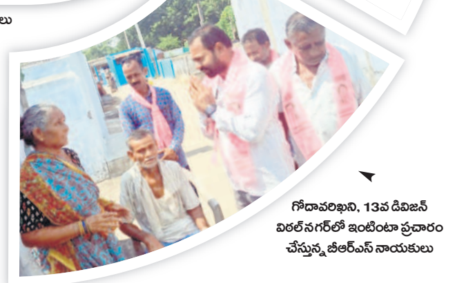
గోదావరిఖని, 13వ డివిజన్ విరల్ నగర్ లో ఇంటింటి ప్రచారం చేస్తున్న జిఆర్ఎస్ నాయకులు