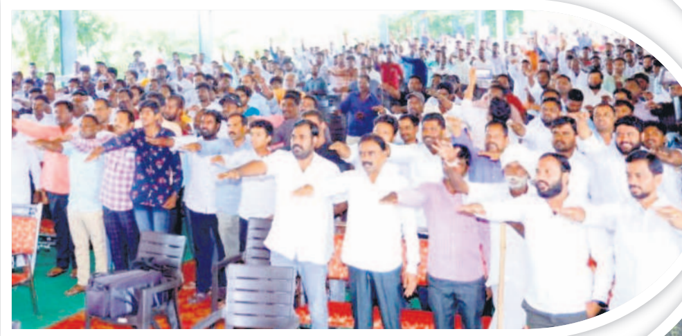
కొత్తపల్లి: చింతకుంటలో ప్రజల్ని సన్మానిస్తున్న నాయకులు, కార్యకర్తలు