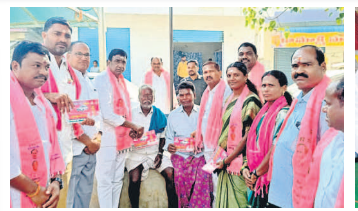
కథలాపూర్: పోతారం ఇంటింటి ప్రచారంలో కాదు గుర్తుకు ఓడియాలని కోరుతున్న నాయకులు

బీఆర్ఎస్ అభ్యర్థులు ఆసునిత్యం ప్రజాక్షేత్రంలోనే ఉంటున్నారు. సిట్టింగ్ ఎమ్మెల్యేలతో పాల్గొని మరోసారి ఆవకాశం కల్పించడంతో షెడ్యూల్ కు ముందు ప్రభుత్వ కార్యక్రమాల్లో విస్తృతంగా పాల్గొన్నారు. అభివృద్ధి కార్యక్రమాల ప్రారంభోత్సవాలు, శంకుస్థాపనలతోపాటు సంక్షేమ పథకాలను లబ్ధిదారులకు అందించేందుకు నిత్యం క్షేత్రస్థాయిలో పర్యటనలు జరిపారు. షెడ్యూల్ విడుదల కావడంతో అన్ని నియోజకవర్గాల్లో ప్రచారాన్ని ప్రారంభించి, ఇంటింటికీ వెళ్తున్నారు. ప్రతి ఒక్కరినీ కలిసి మరోసారి ఆశీర్వాదిస్తూ మరింత అభివృద్ధి చేస్తామని కోరుతున్నారు.