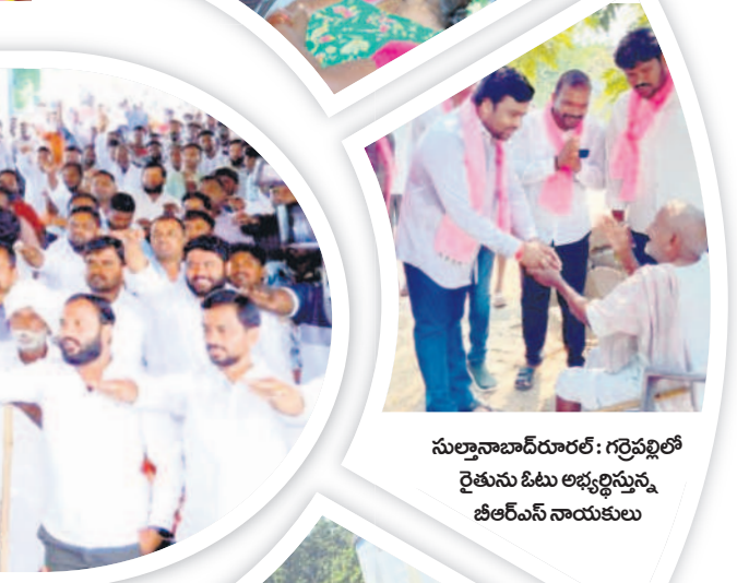
సుల్తానాబాద్ ధారల్: గర్భవల్లిలో రైతును ఓటు అభ్యర్థులను జిఆర్ఎస్ నాయకులు