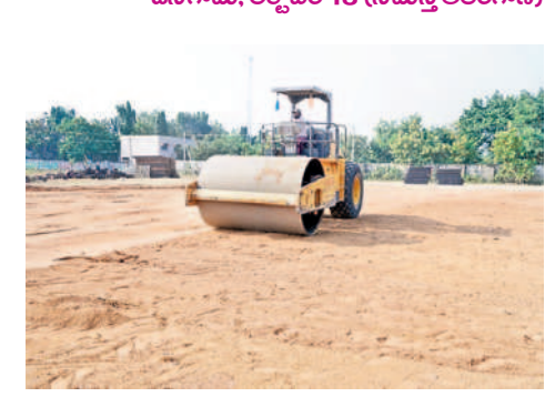
సూర్యాపేట వైపు నుంచి వచ్చే వాహనాలకు బతుకమ్మకుంట, ఎన్ఎంఆర్ గార్డెన్ ప్రాంతాల్లో పార్కింగ్ ఏర్పాట్లను పరిశీలించాలని బీఆర్ఎస్ నాయకులు పోలీసులను కోరారు. హెలిప్యాడ్ కోసం విశాఖనగర్లో బీఆర్ఎస్ సన్నాహక సభ జరిగిన ప్రలాన్ని ఖారు చేసి ఇప్పటికే నిర్మాణ పనులను ప్రారంభించారు. ఎండవేడిమి ఎక్కువగా ఉంటున్న దృష్ట్యా ప్రత్యేకం బారికేడ్లు, షామియానాలు, పెద్ద ఎత్తున ఫ్యాన్లు, కాలర్లు ఏర్పాటు చేయాలని నిర్ణయించారు. బిజినెస్ సభ, సీఎం సభాస్థలి, హెలిప్యాడ్ వద్ద బందోబస్తు వంటి ఏర్పాట్లపై పోలీసులకు కనీసం వచ్చే రోజుల్లోనే సర్దుబాటు చేస్తున్నది. అధినేత సభను విజయవంతం చేసేందుకు బీఆర్ఎస్ జిల్లా శ్రేణులు ఇప్పటికే రంగంలోకి దిగాయి. సన్నాహక సమావేశాలు నిర్వహిస్తూ, భారీగా జన సమీకరణ చేసేందుకు దిశానిర్దేశం చేస్తున్నారు.