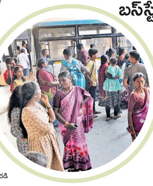
హనుమకొండ బస్ స్టేషన్లో ప్రయాణికుల సందడి

బస్ స్టేషన్లలో దసరా రమ్ • పండుగ సెలవులు రావడంతో సాంతాక్షకు జనం • ఎక్కడచూసినా సందడిగా ప్రయాణి ప్రాంగణాలు బతుకమ్మ, దసరా పండుగలకు సెలవులు రావడంతో సాంతాక్షకు జనం పయనమవుతున్నారు. దింతో ముల్లెమూల నద్దుకొని విద్యార్థులు, విలాసాపలను వెంటబెట్టుకొని వెళ్ళే పెద్దలతో బస్ స్టేషన్లు సందడిగా మారాయి. శుక్రవారం పెద్ద సంఖ్యలో వచ్చిన ప్రయాణికులతో హనుమకొండ బస్ స్టేషన్ కిటికీలూడుతు కనిపించింది. పండుగ కోసం అల్లసీ ప్రత్యేక సర్వీసులను నడిపిస్తున్నది. - స్వామి ఫోటోగ్రాఫర్, వరంగల్, అక్టోబర్ 13