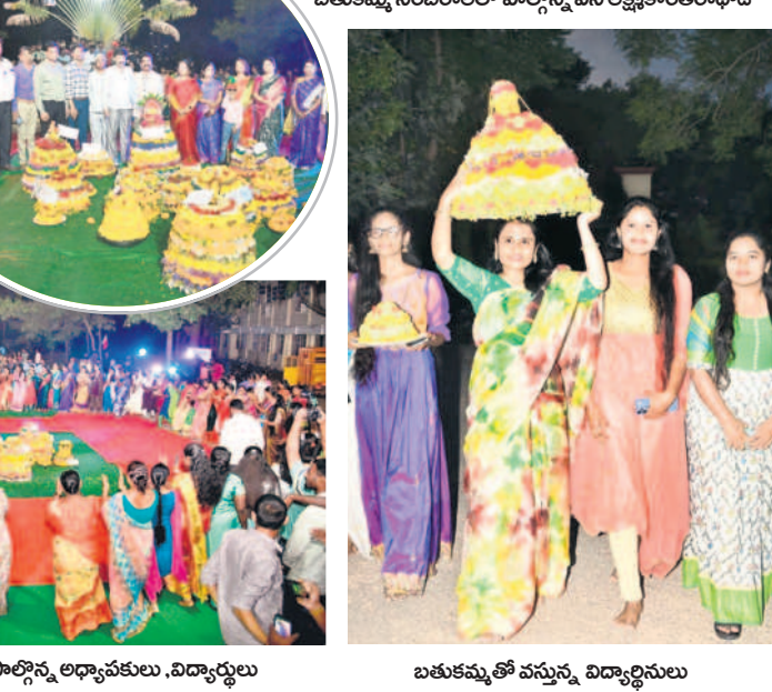
బతుకమ్మతో వస్తున్న విద్యార్థినులు