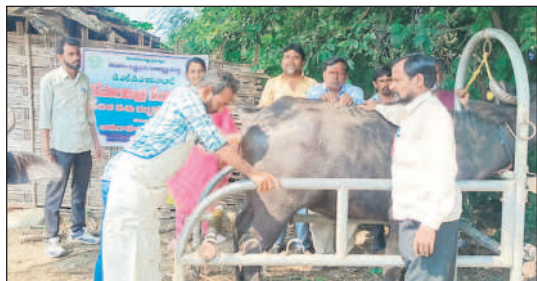
ఝరిలో పశువులను పరీక్షిస్తున్న ఇన్‌చార్జి పశు వైద్యాధికారి