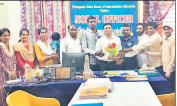
డివకావో పుష్పగుచ్ఛం అందజేస్తున్న అతిథి అధ్యాపక సంఘం నాయకులు