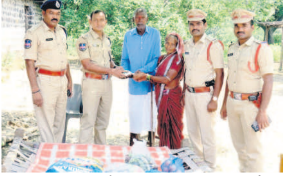
కెరమల మండలం చాలోబడిలో స్థానికులకు నిత్యావసర సరకులు అందజేస్తున్న ఆసిఫాబాద్ ఎస్పీ సురేశ్ కుమార్