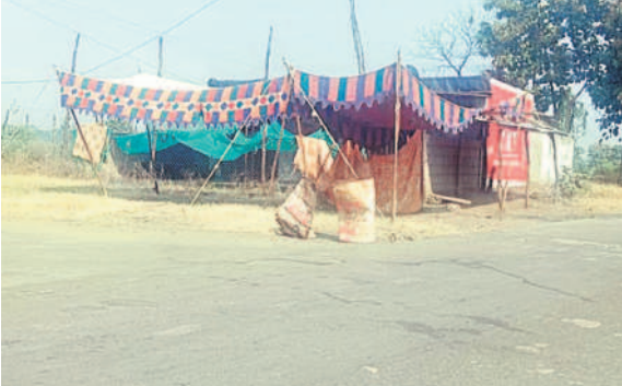
జైమర్ వద్ద ఏర్పాటు చేసిన చెక్పోస్ట్