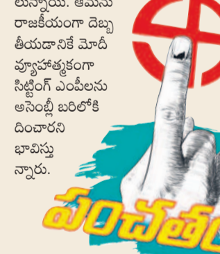
వసంధర వర్గం అసంతృప్తి