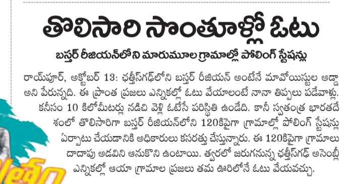
తొలిసారి సాంతూళ్లో ఓటు