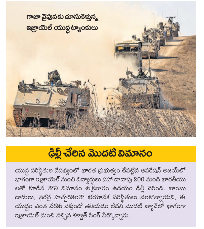
గాజా వైపునకు దూసుకెళ్తున్న ఇజ్రాయేల్ యుద్ధ ట్యాంకులు

సంక్షోభాన్ని సృష్టించే అభిప్రాయం వ్యక్తం చేసింది. ఇజ్రాయేల్ అటువంటి ఆదేశాలను వెనక్కు తీసుకోవాలని ఐరాస అధికార ప్రతినిధి సైఫాన్ దుజాారిన్ అన్నారు. గాజాపై దాడులు ఆపకంటే, గాజా స్థితిపై ఇజ్రాయేల్ దాడులు వెంటనే ఆపకంటే, ఈ యుద్ధం మధ్య ప్రాంతంలోని ఇతర ప్రాంతాలకు కూడా విస్తరిస్తుందని ఇరాన్ హెచ్చరించింది. మరోవైపు, ఇజ్రాయేల్ సైన్యం చేపట్టిన ఒక డేరింగ్ ఆపరేషన్కు సంబంధించిన మీడియాను ఐడీఎఫ్ శుభవార్త విడుదల చేసింది. గాజా సరిహద్దు సమీపంలో చేపట్టిన ఆపరేషన్లో స్థానిక అత్యంత దైర్ఘికానాలోకం పామాస్ చెర నుంచి 250 మంది బందీలను కాపాడారు.