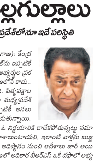
అభ్యర్థుల ప్రకటనలో కాంగ్రెస్ మల్లగుల్లాలు

తెలంగాణలో పాటు మధ్యప్రదేశ్లోనూ ఇదే పరిస్థితి (న్యూఢిల్లీ, అక్టోబర్ 13 (నమస్తే తెలంగాణ): కేంద్ర ఎన్నికల సంఘం ఆసెంబ్లీ ఎన్నికల షెడ్యూల్ను ఇప్పటికే ప్రకటించినా కాంగ్రెస్ పార్టీ మాత్రం ఇంకా అభ్యర్థుల ప్రకటనలపై మల్లగుల్లాలు పడుతున్నది. తెలంగాణలోనే కాదు... మధ్యప్రదేశ్లోనూ ఇదే పరిస్థితి నెలకొన్నది. పీఠావళాల తర్వాత తొలి లిస్టును విడుదల చేస్తామని మధ్యప్రదేశ్ కాంగ్రెస్ నేత కమలీనాథ్ ప్రకటించినప్పటికీ ఆసలు విషయం వేరే ఉన్నప్పటికీ వార్తలు వెలువడుతున్నాయి. ముఖ్యంగా అభ్యర్థుల ఎంపికలో కాంగ్రెస్ ఓ నిర్ణయానికి రాకపోతున్నట్లు నమాచారం. టీడీపీ రానివాళ్ల పార్టీ మాత్రం అవకాశాలుంటాయని, జలాంటి వాళ్లను బుజ్జ గింపడానికి ప్రత్యేక చర్యలు తీసుకోవాలని అభిప్రాయం నుంచి ఆదేశాలు జారీ అయి నట్లు తెలుస్తున్నది. కాగా, ఇప్పటికే తెలంగాణలో అధికార బీజేపీలో ఒకే దఫాలో అభ్యర్థులను ప్రకటించడమే కాకుండా ప్రచారంలో దూసుకుపోతున్న విషయం తెలిసింది.