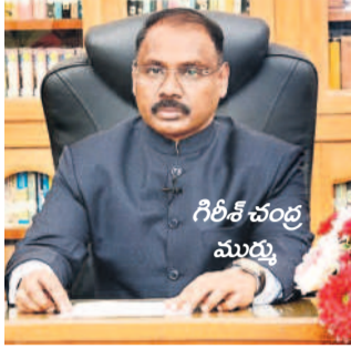
అధికారులు భయపడుతున్నట్లు నమాచారం. కాగ్ నివేదికలపై సంశంక వేయని కాగ్ మరోవైపు తాను కొత్తగా ఎలాంటి నివేదికలపై సంశంకలు వేయడం లేదని కేంద్ర ప్రభుత్వం అంటుంది. కాగ్ అధికారులపై సంశంకలు వేయడం లేదని కేంద్ర ప్రభుత్వం అంటుంది.