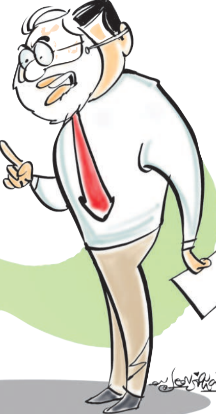
అధికారులు భయపడుతున్నట్లు నమాచారం. కాగ్ నివేదికలపై సంశంక వేయని కాగ్ మరోవైపు తాను కొత్తగా ఎలాంటి నివేదికలపై సంశంకలు వేయడం లేదని కేంద్ర ప్రభుత్వం అంటుంది.