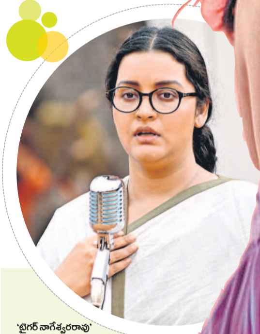
'బ్రిగ్ నాగేశ్వరరావు' చిత్రంలో రేణా దేశాయ్

'సవాళ్ళతో' కూడుకున్న పాత్రలు అరుదుగా దొరుకుతుంటాయి. నటుడి ఆకలి తీరేది అలాంటి పాత్రలు పోషించినప్పుడే అన్నారు బిగ్ బి అమితాబ్. పుట్టినరోజు సందర్భంగా అభిమానులు, శ్రేయోభిలాషులు, బంధువులు బిగ్ బికి శుభాకాంక్షలు తెలిపిన విషయం తెలిసింది. వీరిలో 'కల్కి' చిత్ర యూనిట్ కూడా ఉన్నారు. అమితాబ్ పుట్టినరోజును పురస్కరించుకుని 'కల్కి'లో ఆయన లుక్ ని విడుదల చేశారు మేకప్స్. ఆ లుక్ దేశవ్యాప్తంగా చర్చనీయాంశమైంది. ఈ పోస్టర్ ను తన వ్యక్తిగత సోషల్ మీడియాలో పొందుపరిచి, ఓ కామెంట్ కూడా పేర్ చేశారు బిగ్ బి 'సినిమా రంగం విశ్వం లాంటిది. అడుగుడు గునా ఒడిదొడుకులే, ఎత్తుపల్లాల్లే. వాటన్నింటినీ సమర్థవంతంగా దాటి వెళ్ళాలి. ఇక్కడ విజయం సమిష్టికృషి వల్లే సాధ్యం. ఎన్నో రకాల ఊహలకు, ఆలోచనలకూ చూపే సినిమా' అని పోస్ట్ చేశారు బిగ్ బి అమితాబ్.