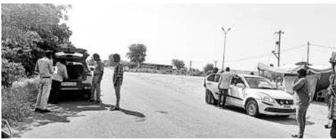
అక్కన్నపేట: వాహనాలను తనిఖీ చేస్తున్న ఎస్ఐ, పోలీస్ సిబ్బంది