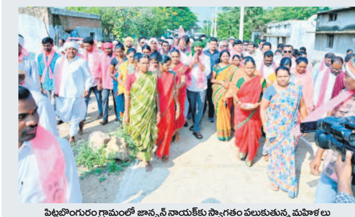
పట్టణంగురం గ్రామంలో జాన్వీ నాయకుల స్వాగతం పలుకుతున్న మహిళలు

అసోసాబాద్-మహారాష్ట్ర సరిహద్దు ప్రాంతాలలో పాటు పొరుగు జిల్లాల సుందీ రాకపోకలు సాగించే రహదారుల వద్ద ఏడు చెక్ పోస్టులను ఏర్పాటు చేశారు. వాంకడి, వెంకట్రావ్ పేట్, కెరపల్లి, దహాగాం, బెజ్జూర్ ప్రాంతాలపై నిరంతర నిషూతో పాటు పొరుగు జిల్లాల సుందీ వచ్చే వాహనాలను తనిఖీలు చేస్తున్నారు. ప్రాంతాల్లో సరిహద్దు ప్రాంతాలపై ప్రత్యేక నిషూ పెట్టారు. జిల్లా ఎస్సీ సురక్షకమార్గ స్వయంగా కెరపల్లి మండలంలోని వార్డల్ పోలింగ్ కేంద్రాలను తనిఖీ చేశారు. జిల్లాలో అతిసమస్యాత్మకంగా పేరుంచిన వారెచ్చెనా గ్రామాన్ని సందర్శించారు. ఎన్నికల సహజంగా నిర్వహించేందుకు పోలీసులు అన్ని చర్యలు తీసుకుంటున్నారు. ఎన్నికల విడుదల పోలీస్ అధికారులు, సిబ్బందితో జట్టుగా కలెక్టర్ బోర్డుడి హేమంత్ పలుమార్లు సమీక్షలు నిర్వహించి ఎన్నికల నియమావళిని కచ్చితంగా అమలు చేయడంతో పాటు ఎన్నికల ఏర్పాట్లను నిరంతరం పర్యవేక్షిస్తున్నారు.