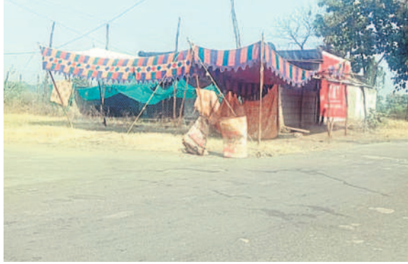
జైమర్ వద్ద ఏర్పాటు చేసిన చెక్ పోస్టు