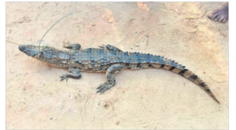
వలకు చిక్కిన మొసలి

అత్తకూరు, అక్టోబర్ 13: చేపల వలకు మొసలి చిక్కిన ఘటన అత్తకూరు పట్టణంలోని పరమేశ్వర స్వామి చెరువులో శుక్రవారం చోటు చేసుకున్నది. పట్టణంలోని మొదటి వార్డు ఖానాపూరికు