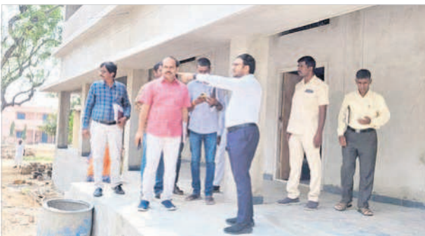
బలిజపల్లిలో పోలింగ్ స్టేషన్ పరిశీలించి అధికారులకు సూచనలిస్తున్న కలెక్టర్ తేజస్ నందలాల్ పవార్

లో నాలుగు పోలింగ్ స్టేషన్లు పరిశీలించారు. పామిరెడ్డిపల్లిలో మరుగుదొడ్డు సరిగా లేవని వెంటనే మరమ్మత్తులు చేయించి అందుబాటులోకి తీసుకురావాలని అధికారులను ఆదేశించారు. వీరాయిపల్లి గ్రామంలోని పోలింగ్ స్టేషన్ ను పరిశీలించారు. కొతులకుంట తండాలో ఒక పోలింగ్ స్టేషన్ ను పరిశీలించి వెంటనే మరుగుదొడ్డు కట్టించాలని సంబంధిత ఎంపీడీవో, పంచాయతీ కార్యదర్శిని ఆదేశించారు. పెద్దమందడి మండలంలోని అన్ని గ్రామాల్లో పోలింగ్ స్టేషన్ వద్ద అన్ని ఏర్పాట్లు చేయాలని తాసిల్దార్ కిషన్, ఎంపీడీవో అక్షయ్ ఆదేశించారు.