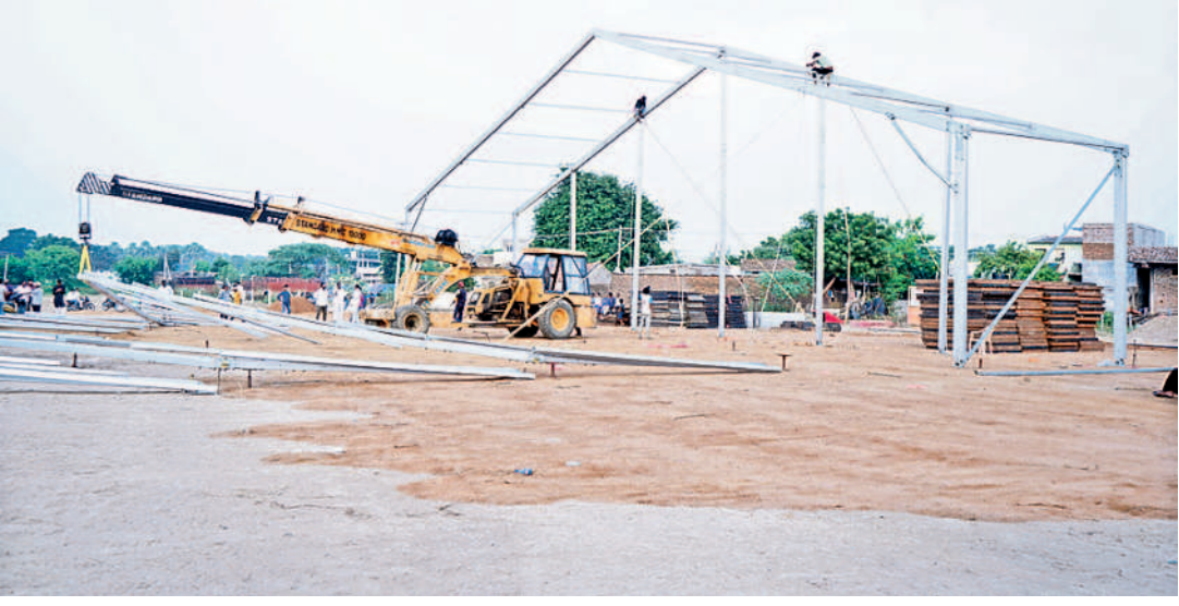
జనగామలో సీఎం కేసీఆర్ సభ కోసం ముమ్మరంగా జరుగుతున్న ఏర్పాట్లు