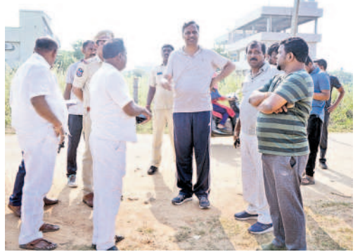
ఏర్పాట్లను పరిశీలిస్తున్న ఎమ్మెల్యే, జనగామ అభ్యర్థి పల్లె