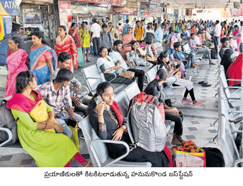
ప్రయాణికులతో కిటికీలాడుతున్న హనుమకొండ బస్ స్టేషన్

• పండుగ సెలవులు రావడంతో సాంతాక్షకు జనం • ఎక్కడచూసినా సందడిగా ప్రయాణ ప్రాంగణాలు బతుకమ్మ, దసరా పండుగలకు సెలవులు రావడంతో సాంతాక్షకు జనం పయనమవుతున్నారు. దింతో ముల్లెమాటల సర్దుకొని విద్యార్థులు, పిల్లలపాఠశాల వెంటబెట్టుకొని వెళ్లే పెద్దలతో బస్ స్టేషన్లు సందడిగా మారాయి. శుభ్రవారం పెద్ద సంఖ్యలో వచ్చిన ప్రయాణికులతో హనుమకొండ బస్ స్టేషన్ కిటికీలాడుతున్నా కనిపించింది. పండుగ కోసం అల్లీస్ ప్రత్యేక సర్వీసులను నడిపిస్తున్నది. - స్వామి ఫోటోగ్రాఫర్, వరంగల్, అక్టోబర్ 13