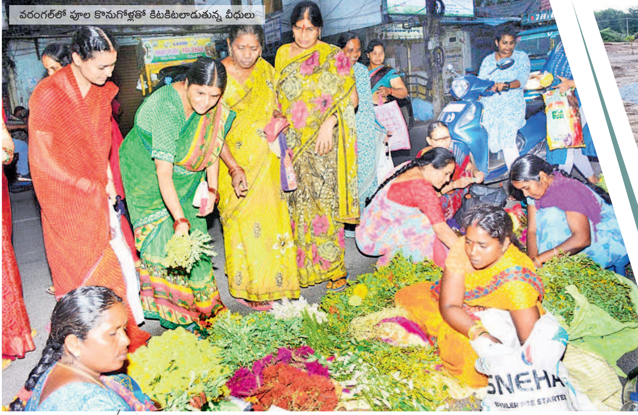
వరంగల్లో పూల కొనుగోళ్లలో కిటికీలాడుతున్న వీధులు