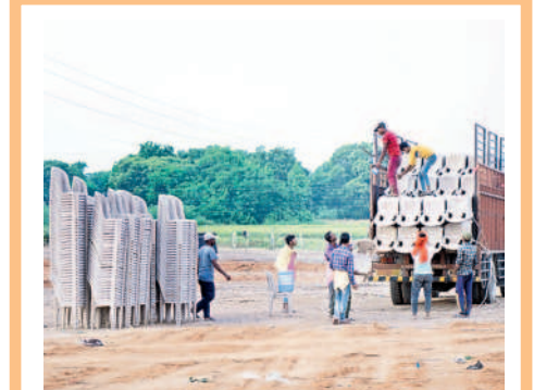
వాహనాలకు ప్రెస్టన్ మైదానం, సూర్యాపేట వైపు నుంచి వచ్చే వాహనాలకు బతుకమ్మకుంట్ల, ఎన్ఎంఆర్ గార్డెన్ ప్రాంతాల్లో పార్కింగ్ ఏర్పాట్లను పరిశీలించాలని బీఆర్ఎస్ నాయకులు షోలీసులను కోరారు. హెలిప్యాడ్ కోసం వికాసనగర్లో బీఆర్ఎస్ సభావేదిక సభా జరిగిన స్థలాన్ని ఖారు చేసి ఇప్పటికే నిర్మాణ పనులను ప్రారంభించారు. ఎండవేడిమి ఎక్కువగా ఉంటున్న దృష్ట్యా ప్రత్యేక బారేకెట్లు, షామియానాలు, పెద్ద ఎత్తున ఫ్యాన్లు, కూలర్లు ఏర్పాటు చేయాలని నిర్ణయించారు. బహిరంగ సభ, సీఎం సభాస్థలి, హెలిప్యాడ్ వద్ద బండో బస్సు వంటి ఏర్పాట్లపై షోలీసులను కనరత్న చేస్తున్నది. అదినేత సభను విజయవంతం చేసేందుకు బీఆర్ఎస్ జిల్లా శ్రేణులు ఇప్పటికే రంగంలోకి దిగాయి. సన్మాహాళిక మహిళలు నిర్వహిస్తూ, భారీగా జన సమీకరణ చేసేందుకు దిశానిర్దేశం చేస్తున్నాయి.