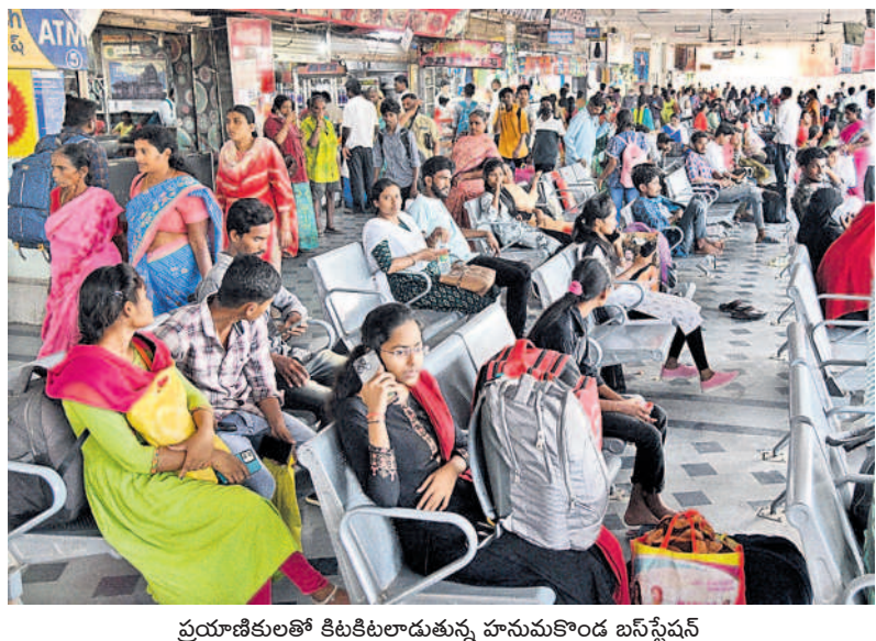
ప్రయాణికులతో కిటికీలాడుతున్న హనుమకొండ బస్ స్టేషన్

• పండుగ సెలవులు రావడంతో సాంతాక్షకు జనం • ఎక్కడచూసినా సందడిగా ప్రయాణ ప్రాంగణాలు బతుకమ్మ, దసరా పండుగలకు సెలవులు రావడంతో సాంతాక్షకు జనం పయనమవుతున్నారు. దింతో ముల్లెమాటల సర్దుకొని విద్యార్థులు, పిల్లలపాఠశాల వెంటబెట్టుకొని వెళ్లే పెద్దలతో బస్ స్టేషన్లు సందడిగా మారాయి. శుభ్రవారం పెద్ద సంఖ్యలో వచ్చిన ప్రయాణికులతో హనుమకొండ బస్ స్టేషన్ కిటికీలాడుతున్న కనిపించింది. పండుగ కోసం అల్లీస్ ప్రత్యేక సర్వీసులను నడిపిస్తున్నది. - స్వామి ఫోటోగ్రాఫర్, వరంగల్, అక్టోబర్ 13