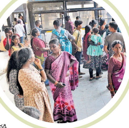
హనుమకొండ బస్ స్టేషన్లో ప్రయాణికుల సందడి

• పండుగ సెలవులు రావడంతో సాంతాక్షకు జనం • ఎక్కడచూసినా సందడిగా ప్రయాణ ప్రాంగణాలు బతుకమ్మ, దసరా పండుగలకు సెలవులు రావడంతో సాంతాక్షకు జనం పయనమవుతున్నారు. దింతో ముల్లెమాటల సర్దుకొని విద్యార్థులు, పిల్లలపాఠశాల వెంటబెట్టుకొని వెళ్లే పెద్దలతో బస్ స్టేషన్లు సందడిగా మారాయి. శుభ్రవారం పెద్ద సంఖ్యలో వచ్చిన ప్రయాణికులతో హనుమకొండ బస్ స్టేషన్ కిటికీలాడుతున్న కనిపించింది. పండుగ కోసం అల్లీస్ ప్రత్యేక సర్వీసులను నడిపిస్తున్నది. - స్వామి ఫోటోగ్రాఫర్, వరంగల్, అక్టోబర్ 13