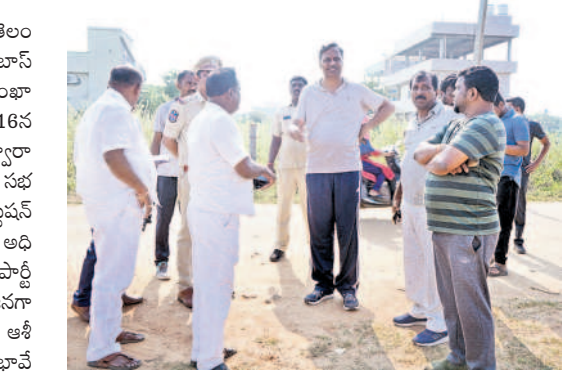
ఏర్పాట్లను పరిశీలిస్తున్న ఎమ్మెల్యే, జనగామ అభ్యర్థి పల్లె