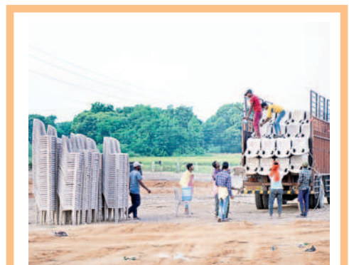
జనగామలో సీఎం కేసీఆర్ సభ కోసం ముమ్మరంగా జరుగుతున్న ఏర్పాట్లు

వాహనాలకు ట్రెస్టర్స్ మైదానం, సూర్యాపేట వైపు నుంచి వచ్చే వాహనాలకు బతుకమ్మకుంట, ఎన్ఎంఆర్ గార్డెన్ ప్రాంతాల్లో పార్కింగ్ ఏర్పాట్లను పరిశీలించాలని బీఆర్ఎస్ నాయకులు షోలీసులను కోరారు. హెలిప్యాడ్ కోసం వికాసనగర్లో బీఆర్ఎస్ సభావేదిక సభా జరిగిన స్థలాన్ని ఖారు చేసి ఇప్పటికే నిర్మాణ పనులను ప్రారంభించారు. ఎండవేడిమి ఎక్కువగా ఉంటున్న దృష్ట్యా ప్రత్యేక బారేకెట్లు, షామియానాలు, పెద్ద ఎత్తున ఫ్యాన్లు, కూలర్లు ఏర్పాటు చేయాలని నిర్ణయించారు. బహిరంగ సభ, సీఎం సభాస్థలి, హెలిప్యాడ్ వద్ద బండో బస్సు వంటి ఏర్పాట్లపై షోలీసులకు కనరత్న చేస్తున్నది. అదినేత సభను విజయవంతం చేసేందుకు బీఆర్ఎస్ జిల్లా శ్రేణులు ఇప్పటికే రంగంలోకి దిగాయి. సన్మాహాళిక మహిళాలు నిర్వహిస్తూ, భారీగా జన సమీకరణ చేసేందుకు దిశానిర్దేశం చేస్తున్నాయి.