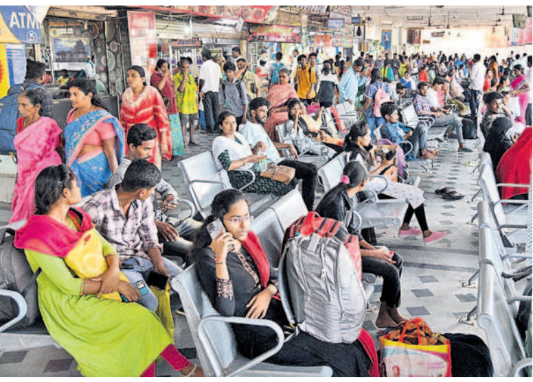
ప్రయాణికులతో కిటికీలూడుతున్న హనుమకొండ బస్ స్టేషన్