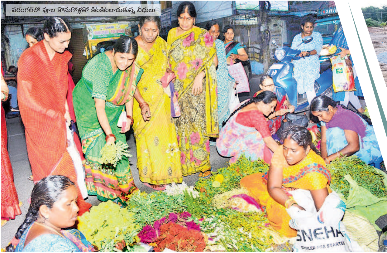
వరంగల్లో పూల కొనుగోళ్లతో కిటికీలూడుతున్న వీధులు