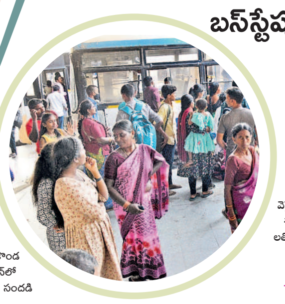
హనుమకొండ బస్ స్టేషన్లో ప్రయాణికుల సందడి