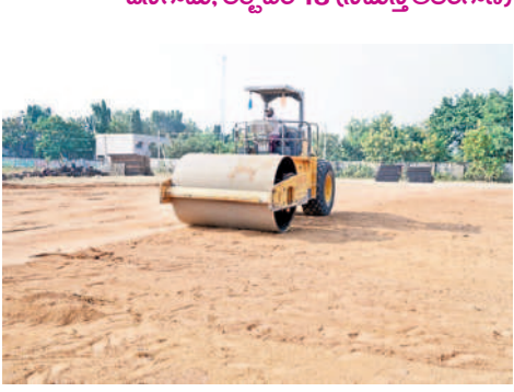
- జనగామ, అక్టోబర్ 13 (నమస్తే తెలంగాణ)