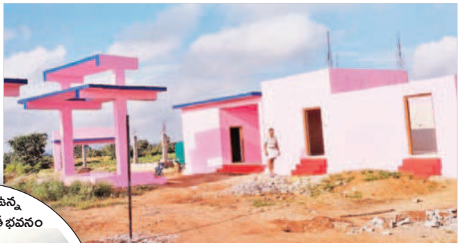
ఊరంచుతందాలో నిర్మించిన శ్వశానవాటిక

చురుగ్గా కొనసాగుతున్నాయి. పారిశుధ్యం కార్యక్రమంలో భాగంగా మొక్కలు నాటి సంరక్షించారు. అలాగే తెలంగాణ ప్రభుత్వం అందిస్తున్న ఆసరా పింఛన్లు తండాలో ప్రతి నెలా 99మందికి అందుతున్నాయి. రైతుబంధుత్వోపాటు మిషన్ భగీరథ నీటితో తండా ప్రజలకు నీటి కష్టాలు లేకుండా పోయాయి. గతంలో దుర్గంధం.. గతంలో ఉమ్మడి గ్రామ పంచాయతీలో