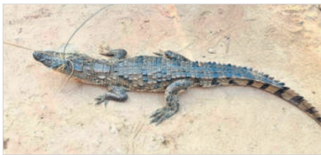
చేపల వలకు చిక్కిన మొసలి

ఆత్మకూరు, అక్టోబర్ 13 : పట్టణంలోని పరమేశ్వరస్వామి చెరువులో మొసలి చేపల వలకు చిక్కింది. పట్టణంలోని మొదటి వార్డు ఖానాపూర్ కు చెందిన మత్స్యకారులు చెరువులో చేపల కోసం వల వేయగా, మొసలి చిక్కింది. బయటకు తీసిన మొసలిని కాసేపయ్యాక తిరిగి చెరువులోనే వదిలేశారు. చెరువులో మొసలి సంచరిస్తున్న నేపథ్యంలో మత్స్యకారులు, ఇతరులు అప్రమత్తంగా ఉండాలని మున్సిపల్ అధికారులు సూచించారు. రేపటి నుంచి బతుకమ్మ సంబురాలు ఆరంభమవుతున్న నేపథ్యంలో పుష్కరఘాట్ వద్ద తగిన రక్షణ చర్యలు తీసుకోవాలని పలువురు కోరుతున్నారు.