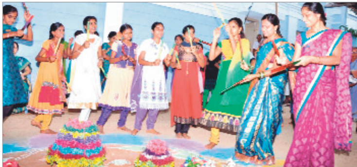
మామడ : బతుకమ్మ ఆడుతున్న మహిళలు (ఫైల్)

బతుకమ్మ చరిత్ర.. బతుకమ్మ పండుగ పుట్టుక గురించి తెలంగాణ వ్యాప్తంగా ఎన్నో కథలు వ్యాప్తిలో ఉన్నాయి. 19