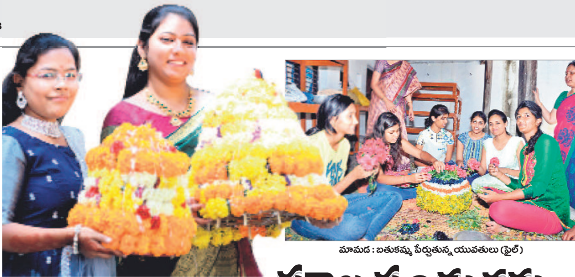
మామడ : బతుకమ్మ పేర్లుతున్న యువతులు (ఫైల్)