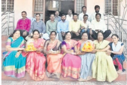
సారంగాపూర్లలోని బీఈడీ కళాశాలలో బతుకమ్మ వేడుకల్లో పాల్గొన్న ఉపాధ్యాయులు