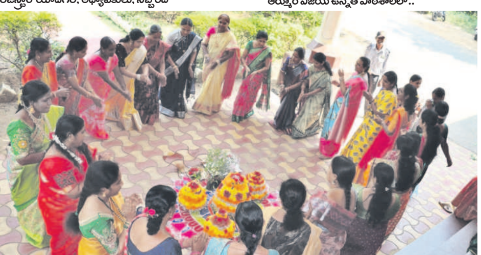
తెలంగాణ యూనివర్సిటీలో బతుకమ్మ ఆడుతున్న అధ్యాపకులు