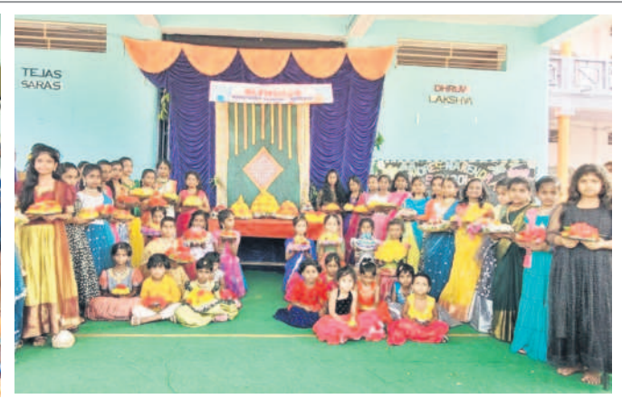
ఆర్తూర్ల్ లోని ఆల్ఫోర్స్ పాఠశాలలో బతుకమ్మలతో విద్యార్థులు