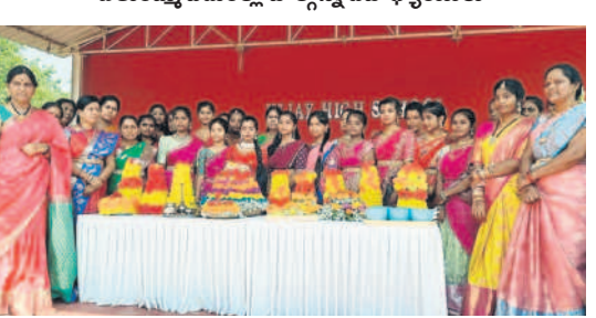
ఆర్కూర్ విజయ్ ఉన్నత పాఠశాలలో..