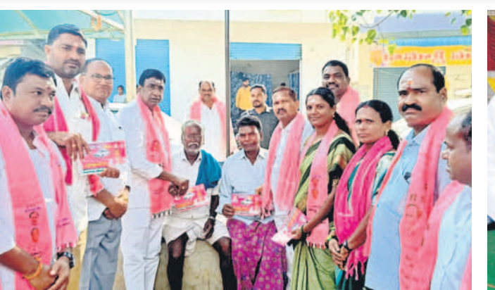
కథలాపూర్: పోతారం ఇంటింటా ప్రచారంలో కాదు గుర్తుకు ఓడీయాలని కోరుతున్న నాయకులు