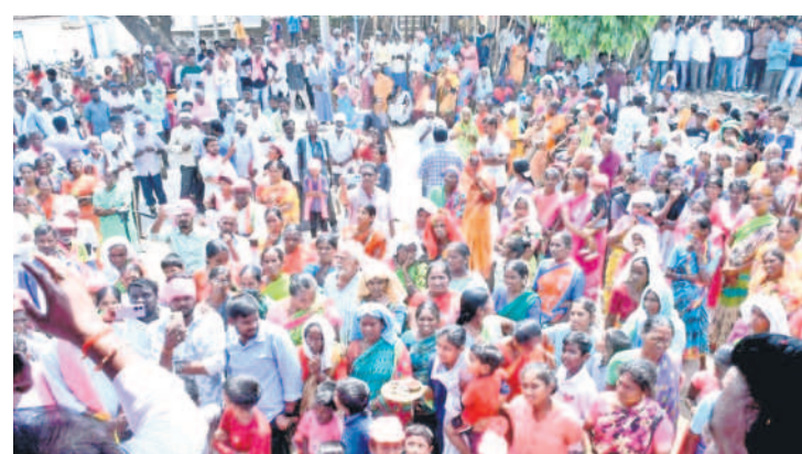
మల్కాల: తక్కువ వయస్సులో ఎమ్మెల్యే ప్రచార ర్యాలీలో పాల్గొన్న ప్రజలు