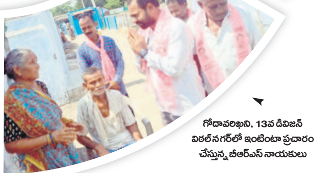
గోదావరిఖని, 13వ డివిజన్ విరలేనగల్లో ఇంటింటా ప్రచారం చేస్తున్న జి.ఆర్.ఎస్ నాయకులు