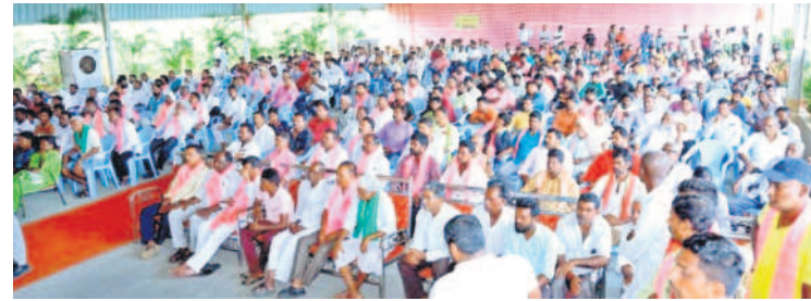
కరీంనగర్ దూరలో: గోపాల్ పూర్ సమావేశానికి హాజరైన ప్రజలు