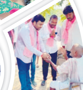
సుల్తానాబాద్ దూరలో: గర్భవతిలో రైతును ఓటు అభ్యర్థిస్తున్న జి.ఆర్.ఎస్ నాయకులు