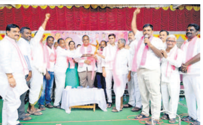
మేడిపల్లి: వేములవాడ అభ్యర్థి చచ్చెర్ల లక్ష్మీవరసం హారతులు, లింగంపల్లి రైతులు