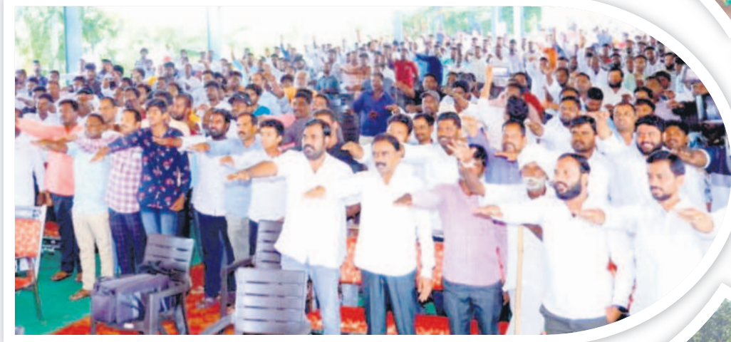
కొత్తపల్లి: చింతకుంటలో ప్రజ్ఞా చేస్తున్న నాయకులు, కార్యకర్తలు