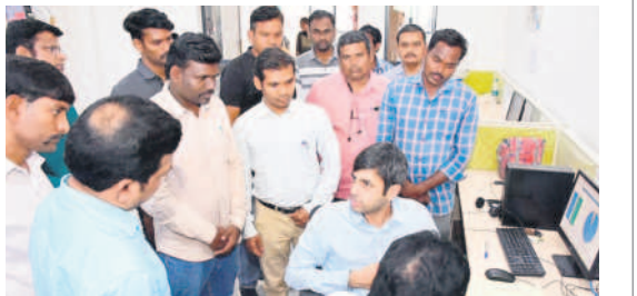
ఫిర్యాదుల కేంద్రంలో అధికారులు సిబ్బందికి సూచనలు చేస్తున్న కలెక్టర్