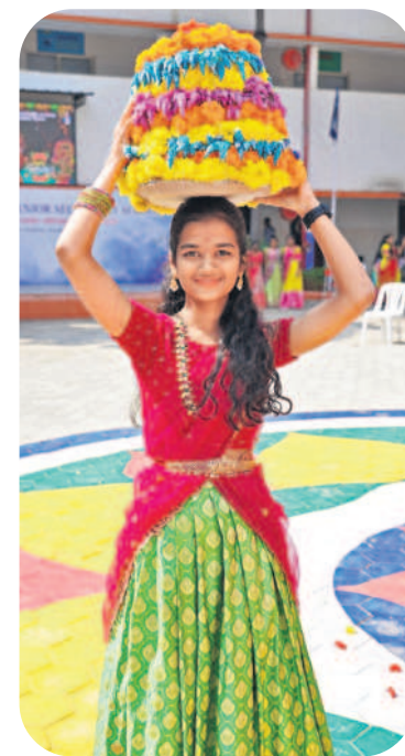
కర్నూలులో బతుకమ్మ ఆడుతున్న విద్యార్థినులు