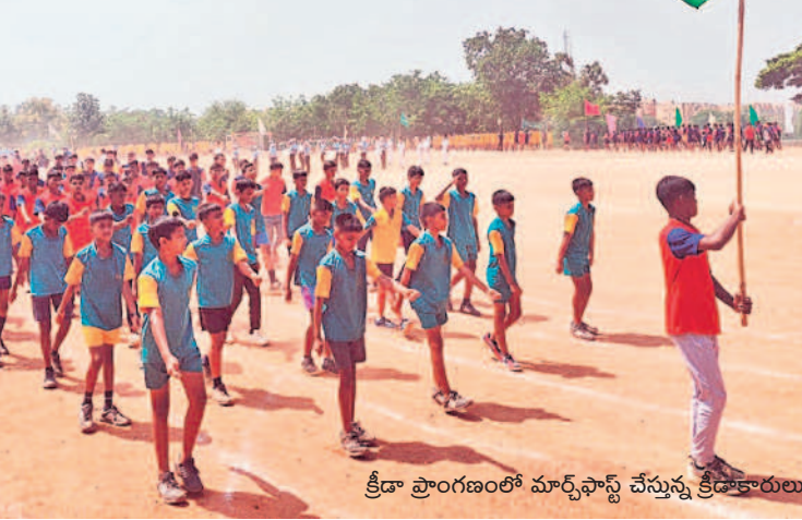
క్రీడా ప్రాంగణంలో మార్చిస్టాన్ చేస్తున్న క్రీడాకారులు