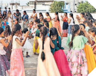
కాండూరు : బతుకమ్మ ఆడుతున్న టీచర్లు, విద్యార్థినులు

ఆడిపాడారు. అనంతరం బతుకమ్మలను స్థానిక చెరువులో నిమజ్జనం చేశారు. అంతకుముందు పాఠశాలల్లో విద్యార్థినులు నిర్వహించిన కోలాటాలు, సాంస్కృతిక కార్యక్రమాలు అలరించాయి. అట్టహాసంగా నిర్వహించిన వేడుకల్లో ఉపాధ్యాయులు మాట్లాడుతూ.. తెలంగాణ సంస్కృతి, సంప్రదాయాలకు బతుకమ్మ పండగ ప్రతీకగా నిలుస్తుందని తెలిపారు. నేటి తరం బతుకమ్మ వేడుకలను ఘనంగా నిర్వహించారు. విద్యార్థినులు సంప్రదాయ దుస్తులు ధరించి తీరొక్క పూలతో బతుకమ్మలను అందంగా అలంకరించారు. ఉపాధ్యాయులు బృందంతో కలిసి బతుకమ్మ పాటలను అలపిస్తూ చూపారు