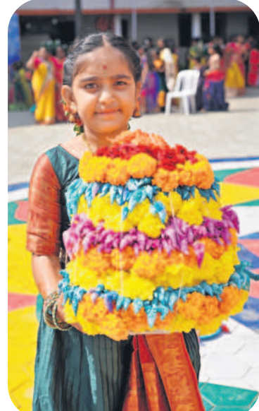
కర్నూలు : బతుకమ్మలతో విద్యార్థినులు