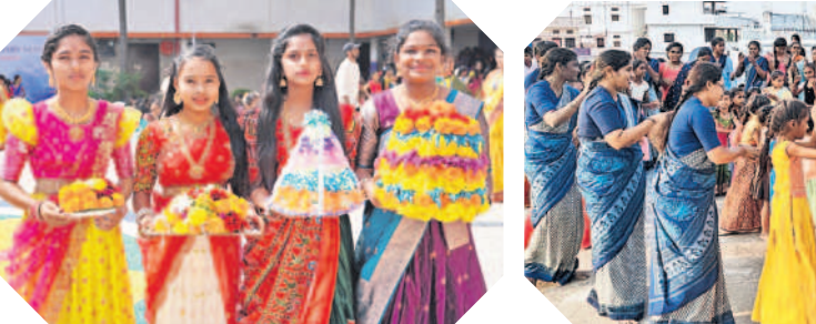
కాండూరు : బతుకమ్మ ఆడుతున్న టీచర్లు, విద్యార్థినులు

ఉమ్మడి రంగారెడ్డి జిల్లాలోని పలు ప్రైవేట్ పాఠశాలల్లో శుభ్రవారం బతుకమ్మ వేడుకలను ఘనంగా నిర్వహించారు. విద్యార్థినులు సంప్రదాయ దుస్తులు ధరించి తీరొక్క పూలతో బతుకమ్మలను అందంగా అలంకరించారు. ఉపాధ్యాయులు బృందంతో కలిసి బతుకమ్మ పాటలను అలపిస్తూ చూపారు