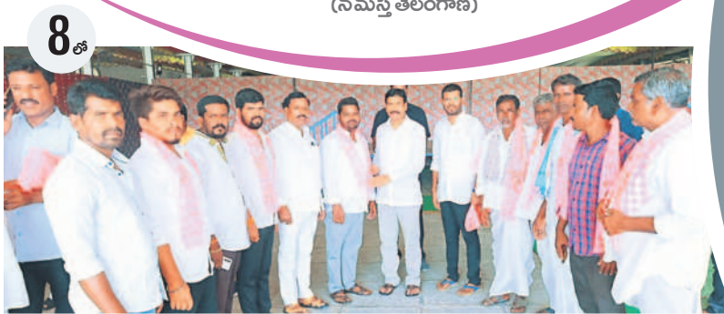
ఎమ్మెల్యే నరేంద్రరెడ్డి సమక్షంలో బీఆర్ఎస్ లో చేరిన ఇతర పార్టీల నేతలు

-సీటీబ్యూరో ప్రధాన ప్రతినిధి, అక్టోబర్ 13 (నమస్తే తెలంగాణ)/ఇబ్రహీంపట్నం