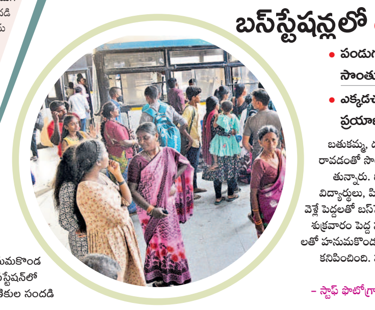
హనుమకొండ బస్ స్టేషన్లో ప్రయాణికుల సందడి