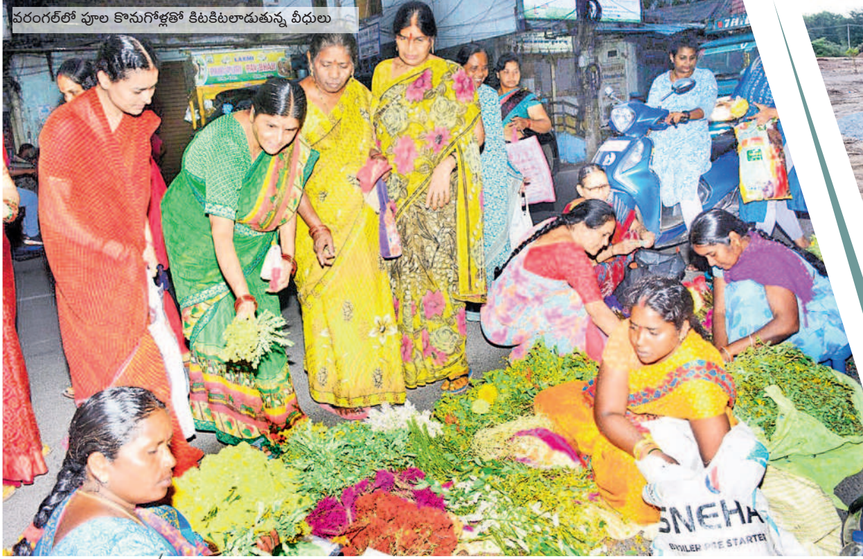
వరంగల్లో పూల కొనుగోళ్లతో కిటకిటలాడుతున్న వీధులు