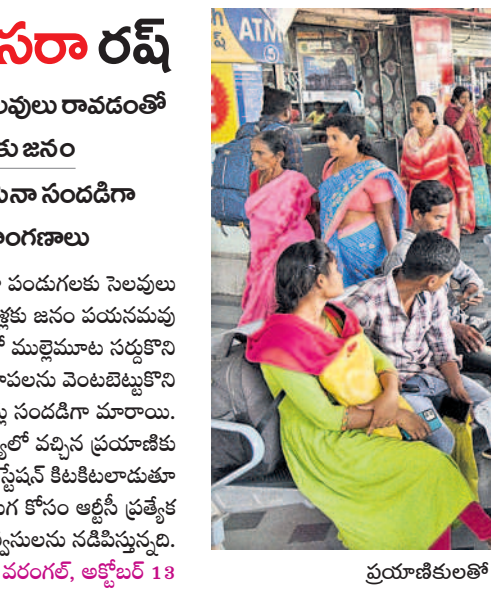
ప్రయాణికులతో కిటకిటలాడుతున్న హనుమకొండ బస్ స్టేషన్

సూర్యాపేట వైపు నుంచి వచ్చే వాహనాలకు బతుకమ్మకుంట, ఎన్ఎంఆర్ గార్డెన్ ప్రాంతాల్లో పార్కింగ్ ఏర్పాట్లను పరిశీలించాలని బీఆర్ఎస్ నాయకులు పోలీసులను కోరారు. హెలిప్యాడ్ కోసం వికాస్ నగర్లో బీఆర్ఎస్ సన్నాహక సభ జరిగిన ప్రలాన్ని ఖారు చేసి ఇప్పటికే నిర్మాణ పనులను ప్రారంభించారు. ఎండవేడిమి ఎక్కువగా ఉంటున్న దృష్ట్యా ప్రత్యేకం బారికేడ్లు, షామియానాలు, పెద్ద ఎత్తున ఫ్యాన్లు, కాలర్లు ఏర్పాటు చేయాలని నిర్ణయించారు. బహిరంగ సభ, సీఎం సభాస్థలి, హెలిప్యాడ్ వద్ద ఎండోబస్సు వంటి ఏర్పాట్లపై పోలీసులతో కలసి చర్చ చేస్తున్నారు. అధినేత సభను విజయవంతం చేసేందుకు బీఆర్ఎస్ జిల్లా శ్రేణులు ఇప్పటికే రంగంలోకి దిగాయి. సన్నాహక సమావేశాలు నిర్వహిస్తూ, భారీగా జన సమీకరణ చేసేందుకు దిశానిర్దేశం చేస్తున్నారు.