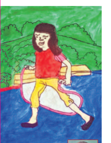
ఎలరీ క్రౌన్స్ పి. రమేశ్, కాలూరు.