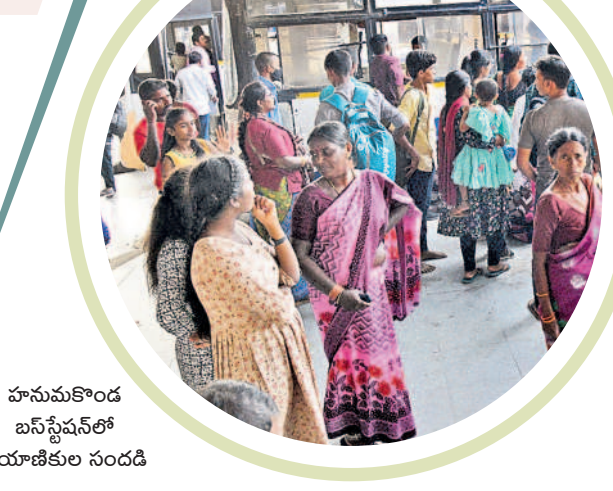
హనుమకొండ బస్ స్టేషన్లో ప్రయాణికుల సందడి