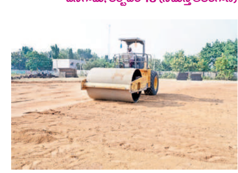
- జనగామ, అక్టోబర్ 13 (నమస్తే తెలంగాణ)