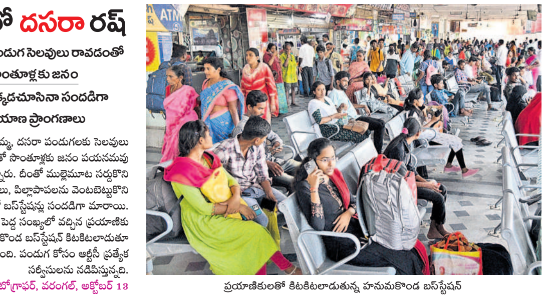
ప్రయాణికులతో కిటకిటలాడుతున్న హనుమకొండ బస్ స్టేషన్