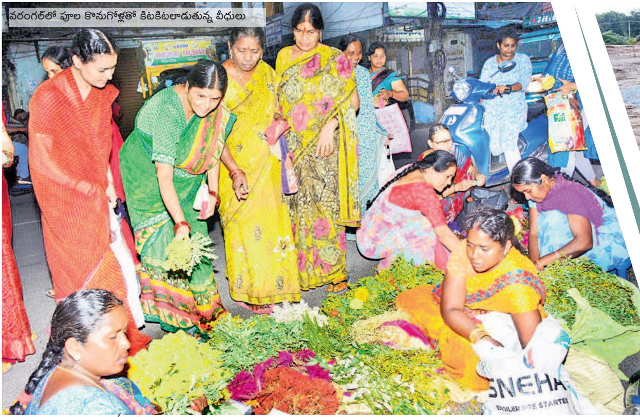
వరంగల్లో పూల కొనుగోళ్లతో కిటకిటలాడుతున్న వీధులు