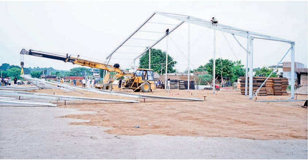
జనగామలో సీఎం కేసీఆర్ సభ కోసం ముమ్మరంగా జరుగుతున్న ఏర్పాట్లు