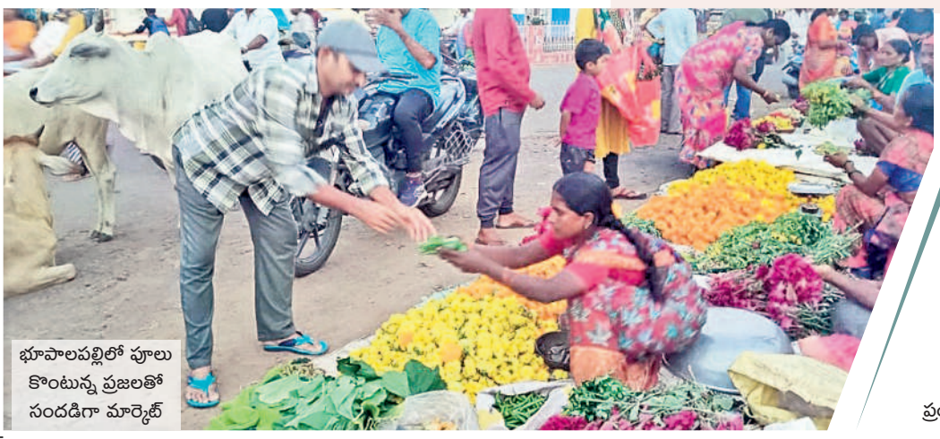
భూపాలపల్లిలో పూల కొంటున్న ప్రజలతో సందడిగా మార్కెట్

తెలంగాణ సంస్కృతీనంద్రదాయాలకు నిలువెత్త ప్రతీకలా నిలుస్తున్న బతుకమ్మ పండుగ వచ్చిందంటే.. పల్లెదారులన్నీ పూల పరిమళాలు వెదజల్లుతాయి. రెండు వైపులా పసుపు ఆరబోసినట్లు తగండ్లు.. వేసుకొనిపోయి నిక్కినిక్కి మాసే గునుగు, పట్టుకున్న.. ముళ్ళ కలప మీద నుంచి పలకరించే కట్ట పూలు.. ఇంటి గోడ మీద నిరిసి మురిసిపోతే మందారాలు, తలుపు నందుల్లోంచి తొంగి మాసే గన్నెడు.. నేలంతా పరుచుకుని, బంగారాన్ని చిచ్చు కనే గుమ్మడి ఇంకా రుద్రాక్ష, గోరంటి.. ఇలా తీరొక్క పువ్వు బతుకమ్మ పండుగను ఆహ్వానిస్తూ కనిపిస్తాయి. ఎంగిలిపూల నుంచే ఆడబద్దల సందడి మొదలవుతుంది. ప్రత్యేక సిద్ధంగా లభించే రకరకాల పూలు, వాటితో గొర్రెమ్మను పూజించడం ఈ పండుగలోని విశిష్టత. మెట్టినింటికి వెళ్ళిన మహిళలంతా ప్రతి బతుకమ్మ పండుగకు పుట్టింటికి వేరుకుంటారు. తొమ్మిదిరోజులపాటు మమతానురాగాల బతుకమ్మలను పేర్చి, వంతానం, పాడి పంటా చల్లగండాలని ఆడిపాడుతారు. ఏచాదికి నలిపడా ఆనందాన్ని మూటగట్టు కొని వెళ్తారు. తమకు మంచి భర్త దొరకాలని నమ్మాలని తొంగి మాసే గన్నెడు.. నేడు ఎంగిలిపూల బతుకమ్మతో వేడుకలు ప్రారంభం కానుండగా, శుభ్రవారం నుంచే సందడి నెలకొంది. మార్కెట్లన్నీ పూలగోనుగలుదారులతో కళకళలాడుతున్నాయి. కొత్తబట్టలు కొనుక్కునేవారితో వస్త్రధుకాణాలు కిక్కిరిసిపోతున్నాయి.