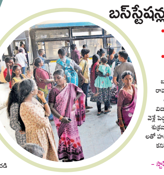
హనుమకొండ బస్ స్టేషన్లో ప్రయాణికుల సందడి