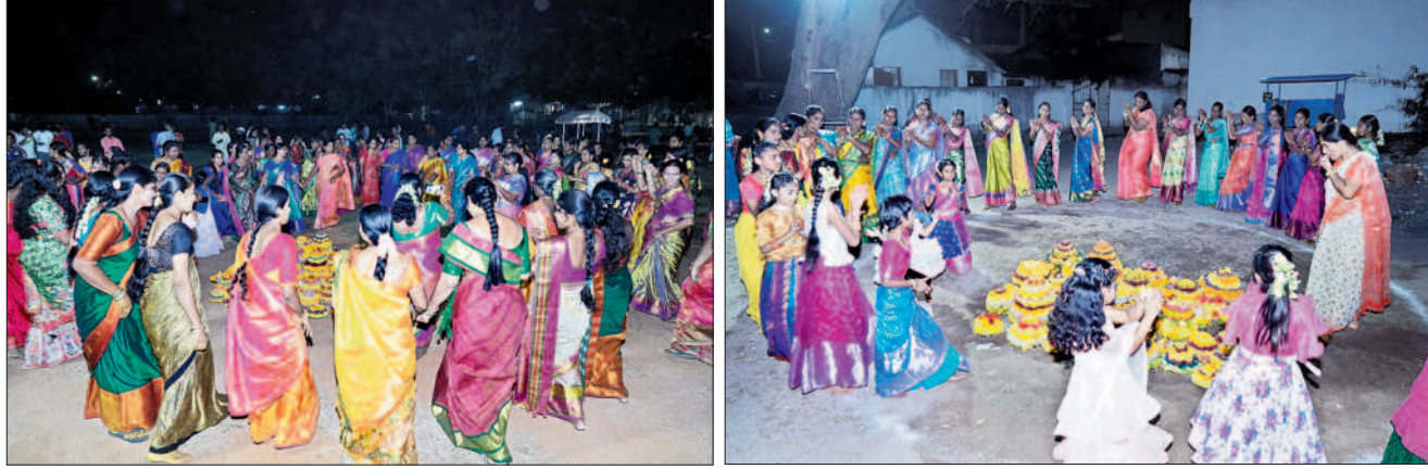
జనగామ పట్టణంలో బతుకమ్మ ఆడుతున్న మహిళలు, యువకులు, బిచ్చారులు