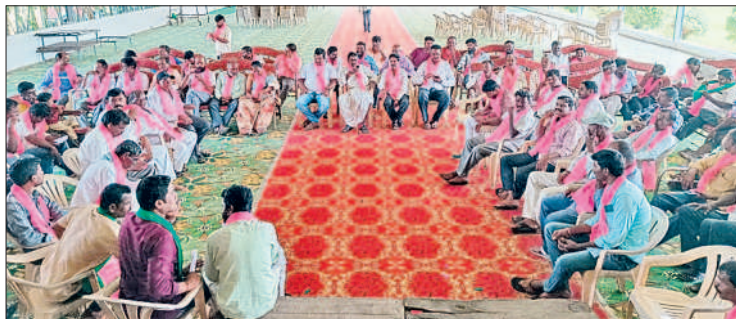
వడ్డకొండలో సీఎం కేసీఆర్ భాషారంగ సభకోసం చర్చిస్తున్న నాయకులు