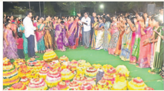
మహిళలతో బతుకమ్మ ఆడుతున్న మంత్రి పువ్వాడ అజయకుమార్