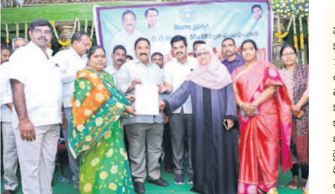
ఇళ్లర్లాల పట్టాలు పంపిణీ చేస్తున్న ఎమ్మెల్యే (పైర)