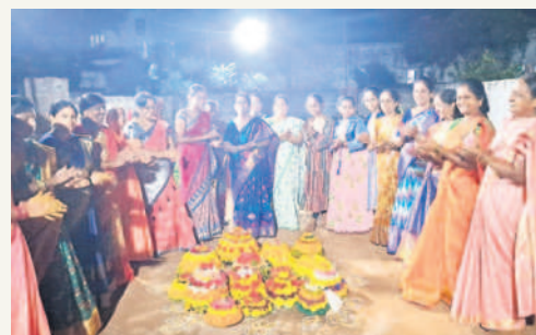
కొత్తగూడెం మధురబస్టిలో బతుకమ్మ ఆడుతున్న మహిళలు