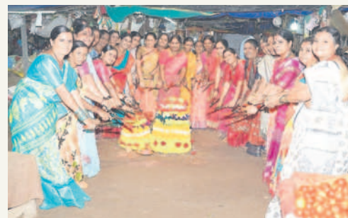
కొత్తగూడెం రైతుబజారులో బతుకమ్మ ఆడుతున్న మహిళలు