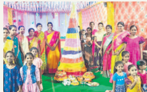
సారపాక : బతుకమ్మ వద్ద మహిళలు