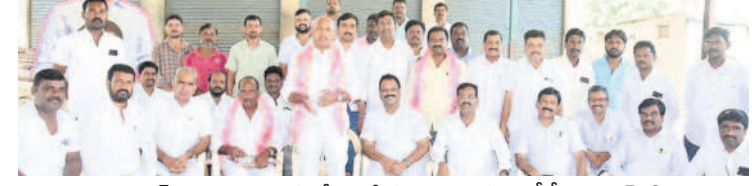
భూదాన్ పోచంపల్లి : సమావేశంలో మాట్లాడుతున్న ఎంపీపీ ప్రభాకర్ రెడ్డి

భూదాన్ పోచంపల్లి, అక్టోబర్ 14 : ఈనెల 16న భువనగిరిలో నిర్వహించే బీఆర్ఎస్ ప్రజా ఆశీర్వాద సభకు ప్రజలు అధిక సంఖ్యలో తరలివచ్చి విజయవంతం చేయాలని ఎంపీపీ మాడుగుల ప్రభాకర్ రెడ్డి కోరారు. శనివారం పట్టణంలోని జన సమీకరణ కార్యక్రమంలో ముఖ్యనాయకుల సమావేశంలో ఆయన మాట్లాడారు. ఈ సభకు మండలం నుంచి 8 వేల మందిని 150