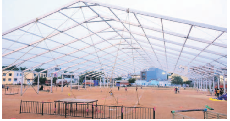
సభా స్థలి వద్ద జరుగుతున్న ఏర్పాట్లు

యాదాద్రి భువనగిరి, అక్టోబర్ 14 (నమస్తే తెలంగాణ) : ఎన్నికల షెడ్యూల్ విడుదలైంది. ఇక సీఎం కేసీఆర్ కడన రంగలోకి దిగనున్నారు. ప్రజల్లోకి వెళ్లేందుకు జిల్లా పర్యటన చేపట్టనున్నారు. ఇటీవల టూర్ షెడ్యూల్ కూడా ప్రకటించారు. ఈ నెల 16న భువనగిరికి రానున్నారు. మొదటగా జనగాం జిల్లాకు వెళ్లి అక్కడి నుంచి భువనగిరి పట్టణానికి చేరుకుంటారు.