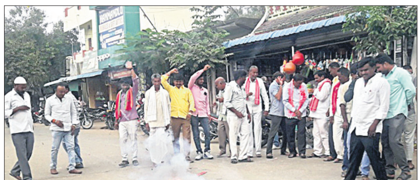
నార్సూర్: పటాకులు కాలుస్తున్న బీఆర్ఎస్ నాయకులు