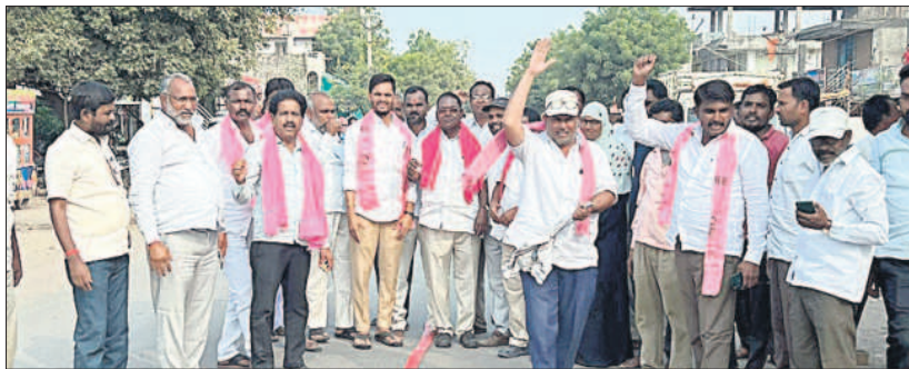
బేల: సంబురాలు చేసుకుంటున్న బీఆర్ఎస్ నాయకులు

జైనద్, అక్టోబర్ 15 : బీఆర్ఎస్ మ్యూనిసిపాలిటీపై హర్షం వ్యక్తం చేస్తూ భోరణిలో పార్టీలో నాయకులు