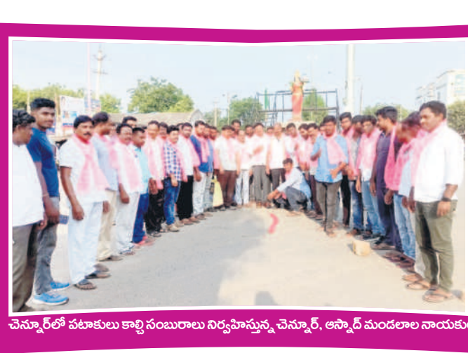
చెన్నూర్ లో పటాకులు కాల్చి సంబురాలు నిర్వహిస్తున్న చెన్నూర్, ఆస్కార్ మండలాల నాయకులు