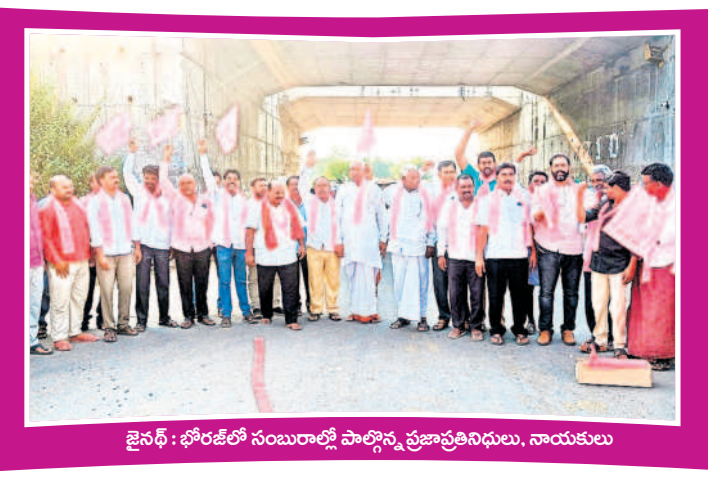
జైసల్: భోరణిలో సంబురాలి పాల్గొన్న ప్రజాప్రతినిధులు, నాయకులు