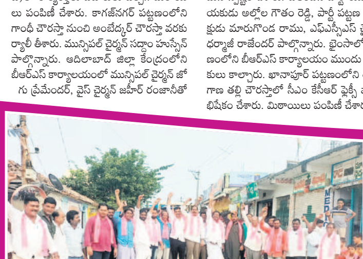
లక్ష్మణాబాద్: పటాకులు కాలుస్తున్న జిఆర్ఎస్ నాయకులు