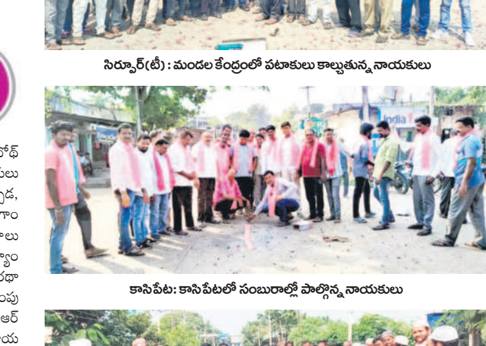
దిలావర్పూర్: సంబురాలి పాల్గొన్న జిఆర్ఎస్ నాయకులు