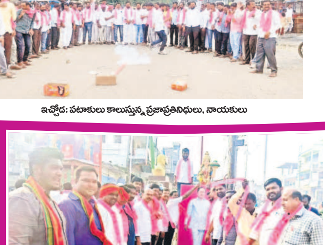
ఇచ్చోడ: పటాకులు కాలుస్తున్న ప్రజాప్రతినిధులు, నాయకులు