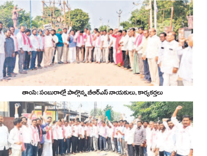
తాసం: సంబురాలి పాల్గొన్న జిఆర్ఎస్ నాయకులు, కార్యకర్తలు