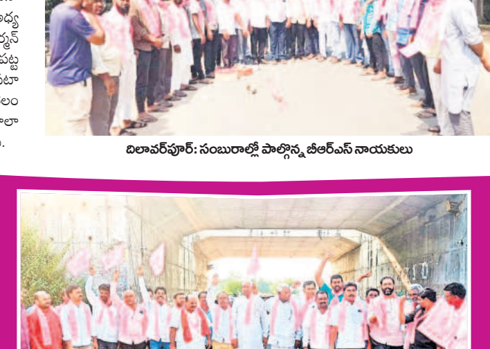
జైసల్: భోరణిలో సంబురాలి పాల్గొన్న ప్రజాప్రతినిధులు, నాయకులు