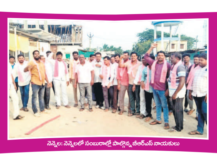
నెన్నెల: నెన్నెలలో సంబురాలి పాల్గొన్న జిఆర్ఎస్ నాయకులు