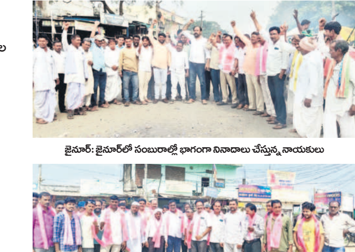
జైసూర్: జైసూర్ లో సంబురాలి భాగంగా నివాదాలు చేస్తున్న నాయకులు