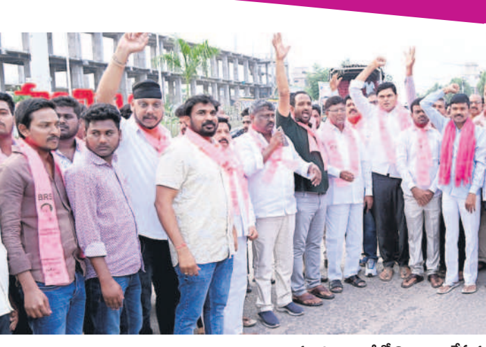
మంచెర్యాల ఐటిలో నివాదాలు చేస్తున్న నాయకులు