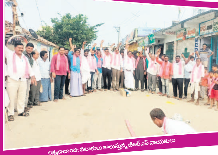
లక్ష్మణాబాద్: పటాకులు కాలుస్తున్న జిఆర్ఎస్ నాయకులు