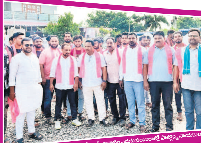
ఆసిఫాబాద్ టౌన్: ఆసిఫాబాద్ లో కోవ లక్ష్మి నివాసం ఎదుట సంబురాలి పాల్గొన్న నాయకులు