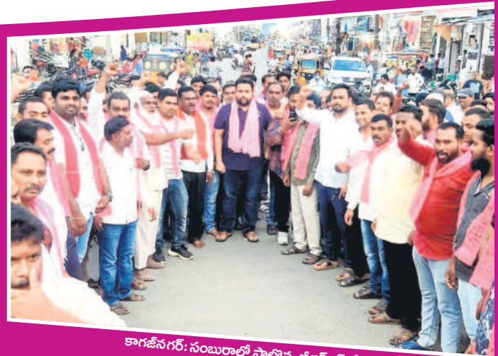
కాగజేనగర్: సంబురాలి పాల్గొన్న జిఆర్ఎస్ శ్రేణులు