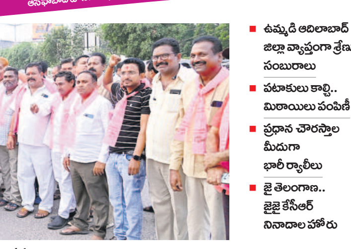
జై తెలంగాణ.. జై జై కేసీఆర్ నివాదాల పహారీ