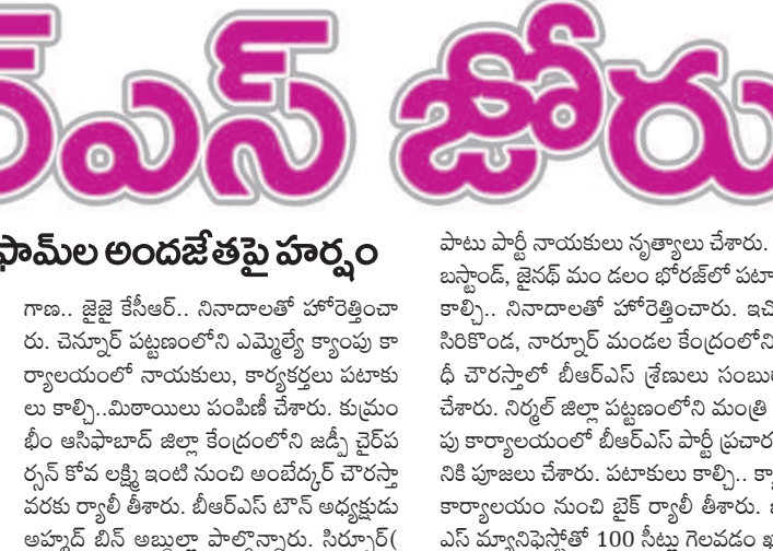
కాసిపేట: కాసిపేటలో సంబురాలి పాల్గొన్న నాయకులు