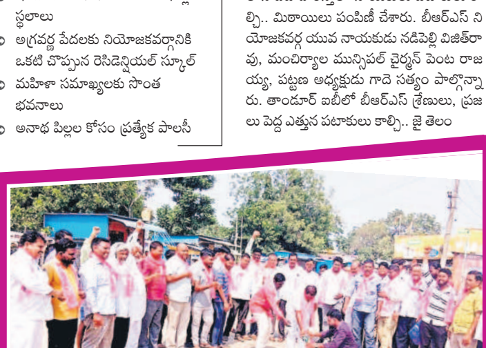
బాసర్: రైల్వేస్టేషన్ ఎదుట పటాకులు కాలుస్తున్న జిఆర్ఎస్ నాయకులు