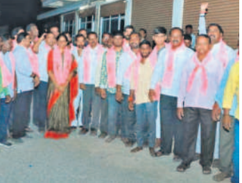
విద్యాశాఖ మంత్రి సబితా ఇంద్రారెడ్డి సమక్షంలో బీఆర్ఎస్ లో చేరుతున్న కాంగ్రెస్, బీజేపీ నాయకులు

బడంగిపేట, అక్టోబర్ 15 : సబ్బండ వర్గాల సంక్షేమాన్ని సరికొత్త శిఖరాలకు మ్యూనిసిపాలిటీను ముఖ్యమంత్రి కేసీఆర్ ప్రకటించడం పట్ల యావత్ తెలంగాణ ప్రజలు హర్షిస్తున్నారని విద్యాశాఖ మంత్రి పి సబితా ఇంద్రారెడ్డి అన్నారు. ఆదివారం రాత్రి బడంగిపేట మున్సిపల్ కార్పొరేషన్ పరిధిలోని పెద్ద బావి మల్లారెడ్డిలో బాలాపూర్ కు చెందిన బీజేపీ, కాంగ్రెస్ పార్టీలకు చెందిన నాయకులు మంత్రి సమక్షంలో బీఆర్ఎస్ పార్టీలో చేరారు. మంత్రి వారికి గులాబీ కండువా కప్పి