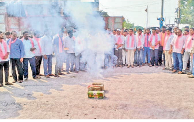
భూపాలపల్లి జిల్లా కేంద్రంలో పటాకులు కాల్చి సంబురాలు జరుపుతున్న బీఆర్ఎస్ నాయకులు

కమలాపూర్ : ముఖ్యమంత్రి కేసీఆర్ ఎన్నికల మేనిఫెస్టో బాగుంది. అన్ని వర్గాలకు ఉపయోగపడేలా పథకాలు ఉన్నాయి. కేసీఆర్ బీమా.. ప్రతి ఇంటికి భీమా ఇవ్వనుంది. ఇంటి పెద్ద చనిపోతే ఆ కుటుంబం ఇబ్బంది పడకుండా బీమా కింద రూ.5 లక్షలు ప్రకటించారు. కేసీఆర్ మాట ఇన్నే అమలు చేస్తామని చెప్పడం ఉంది. రైతుల కోసం, మహిళల కోసం, విద్యార్థుల ఉన్నత చదువుల కోసం, మైనార్టీల సంక్షేమం కోసం అనేక పథకాలు అమలు చేస్తున్నారు. మళ్ళీ కేసీఆర్ గెలవడం ఖాయం. - కొలిపాక రాజేందర్, కమలాపూర్