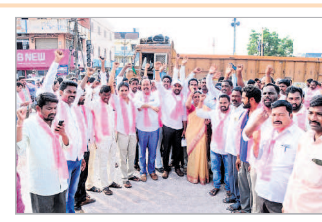
భూపాలపల్లిలో నినాదాలు చేస్తున్న బీఆర్ఎస్ పార్టీ శ్రేణులు