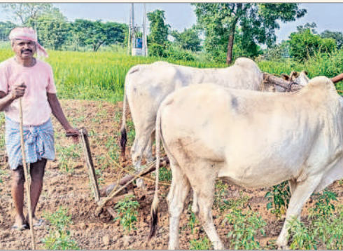
సీఎం కేసీఆర్ కు రుణపథం..