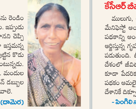
కేసీఆర్ బీమాతో ప్రజల్లో భీమా