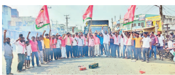
దంతాలపల్లిలో పటాకులు కాలుస్తున్న బీఆర్ఎస్ పార్టీ నాయకులు

పెన్షన్లు పెంచడం, రైతు బంధు కింద పెట్టుబడి సాయాన్ని పెంచుతామని పేర్కొనడంపై అయో వర్గాలు సంతోషం వ్యక్తం చేస్తున్నాయి. అర్హులైన మహిళలకు ప్రతి నెల రూ.3 వేల చొప్పున భృతి, పేద మహిళలకు రూ.4000 గ్యాస్ సిలిండర్, మహిళా సమాఖ్యలకు సొంత భవనాలు నిర్మించనున్నట్లు మేనిఫెస్టోలో పేర్కొనడంపై నాటిలోనే చేసిన పానుకుతున్నది. ఆరోగ్య శ్రీ కింద వైద్యం కోసం అందించే మొత్తాన్ని రూ.5 లక్షల నుంచి రూ.15 లక్షలకు పెంచడం, అగ్రవర్గాల్లోని పేద పిల్లల చదువుల కోసం నియోజకవర్గానికో గురుకులాన్ని నెలకొల్పడం, ఉద్యోగుల సీపీఎన్ఎస్ అధ్యయన కమిటీని నియమించుకున్నట్లు తెలపడంతో హార్షం వ్యక్తమవుతున్నది. అన్ని వర్గాలకు మరొక తోడ్పాటు అందించేలా ఉండడంతో సర్వత్రా చర్చ జరుగుతున్నది. మేనిఫెస్టోపై బీఆర్ఎస్ పార్టీ శ్రేణులు ఉమ్మడి జిల్లా వ్యాప్తంగా సంబురాలు నిర్వహించారు. ప్రధాన కూడళ్ల వద్ద పటాకులు కాల్చారు. దీనిని చిహ్నీకాంక్షతో రాజీవులు తీశారు. ఊరూరా, వాడవాడూ బీఆర్ఎస్ నకు అనుకూలంగా నినాదాలు చేశారు.