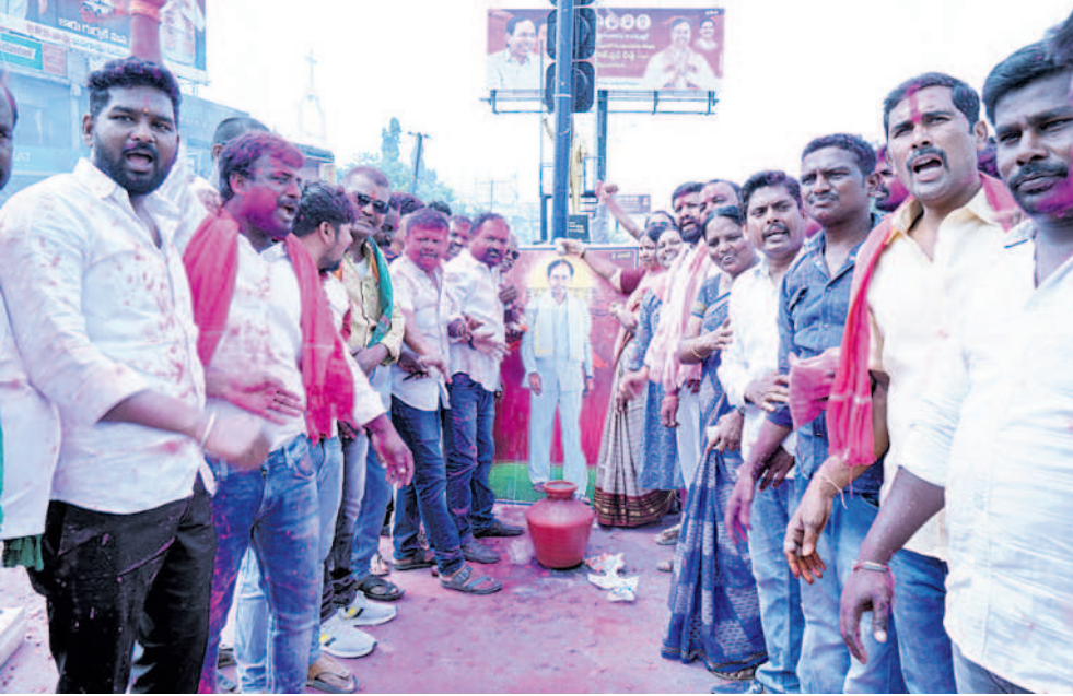
జనగామలో సీఎం కేసీఆర్ చిత్రపటానికి పాలాభిషేకం చేస్తున్న బీఆర్ఎస్ నాయకులు, కార్యకర్తలు