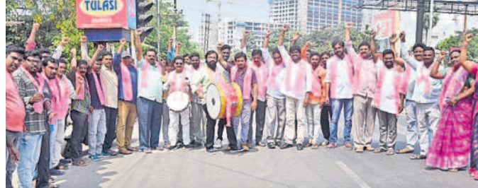
వరంగల్ ఎంజీఎం కూడలిలో డప్పుచప్పుకోతే నినాదాలు చేస్తున్న బీఆర్ఎస్ కార్యకర్తలు