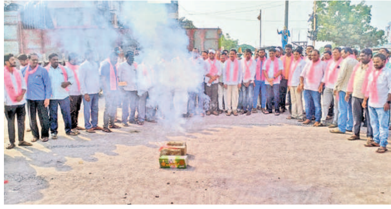
భూపాలపల్లి జిల్లా కేంద్రంలో పటాకులు కాల్చి సంబారాలు జరుపుతున్న బీఆర్ఎస్ నాయకులు