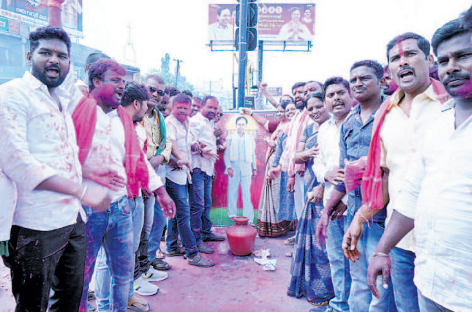
జనగామలో సీఎం కేసీఆర్ చిత్రపటానికి పాలాభిషేకం చేస్తున్న బీఆర్ఎస్ నాయకులు, కార్యకర్తలు