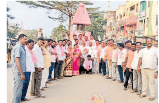
నర్సంపేటలో సంబరాలు చేసుకుంటున్న బీఆర్ఎస్ శ్రేణులు

పెన్షన్లు పెంచడం, రైతు బంధు కింద పెట్టుబడి సాయాన్ని పెంచుతామని పేర్కొనడంపై అయో వర్గాలు సంతోషం వ్యక్తం చేస్తున్నాయి. అర్హతైన మహిళలకు ప్రతి నెల రూ.3 వేల చొప్పున భృతి, పేద మహిళలకు రూ.4000 గ్యాస్ సిలిండర్, మహిళా సమాఖ్యలకు సొంత భవనాలు నిర్మించనున్నట్లు మేనిఫెస్టోలో పేర్కొనడంపై నాటిలోకం చేసినోళ్ల పొగుడుతున్నది. ఆరోగ్యశ్రీ కింద వైద్యం కోసం అందించే మొత్తాన్ని రూ.5 లక్షల నుంచి రూ.15 లక్షలకు పెంచడం, అగ్రవర్గాల్లోని పేద పిల్లల చదువుల కోసం నియోజకవర్గానికో గురుకులాన్ని నెలకొల్పడం, ఉద్యోగుల సీపీఎన్ఎస్ అధ్యయన కమిటీని నియమించుకున్నట్లు తెలవడంతో హార్షం వ్యక్తం చేస్తున్నది. అన్ని వర్గాలకు మరొక తోడ్పాటు అందించేలా ఉండడంతో సర్వత్రా చర్చ జరుగుతున్నది. మేనిఫెస్టోపై బీఆర్ఎస్ పార్టీ శ్రేణులు ఉమ్మడి జిల్లా వ్యాప్తంగా సంబరాలు నిర్వహించారు. ప్రధాన కూడళ్ల వద్ద పటాకులు కాల్చారు. దీనిని చిహ్నీకాంక్షతో రాజీవులు తీశారు. ఊరూరా, వాడవాడూ బీఆర్ఎస్ నకు అనుకూలంగా నినాదాలు చేశారు.