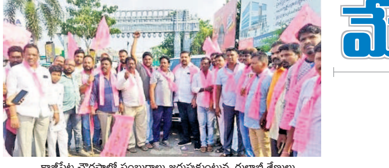
కాజీపేట చౌరస్తాలో సంబరాలు జరుపుకుంటున్న గులాబీ శ్రేణులు