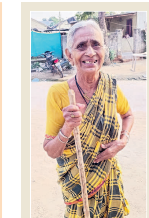
కేసీఆర్ నా పెద్ద కొడుకు..

సర్పంచలపేట : నాకు కొడుకులు లేరు.. ముగ్గురూ బిడ్డలే. ఒక బిడ్డ మూగా. నా భర్త చచ్చిపోయి వాస్తూ తొంది. నాకు 75 ఏళ్ల ఉంటుంది. గతంలో నేను నా బిడ్డ కూలీకి పోతేనే బతుకుతాను. ఒక్కోసారి పని దొరికే చాలా ఇబ్బందిపడ్డం. అప్పుడు ఉన్న సర్కారోళ్లు రూ.200 వేలు ఎటూ సరిపోయాయి. ఇప్పుడు కేసీఆర్ నా బిడ్డకు రూ.4వేలు, నాకు రూ. 2వేలు పింఛన్ ఇస్తున్నాడు. మళ్ళీ గెలిస్తే పైనలు ఎక్కువ ఇవ్వడని నా మరది, చెబితే తెలిసింది. నాకు కొడుకు లేకున్నా పెద్ద కొడుకు లెక్క కేసీఆర్ నెలనెలా నాకరిదారుడికి ఇచ్చినట్లు పింఛన్ ఇస్తున్నాడు. ఇంత మంచిగా పైనలు ఇస్తున్న నా పెద్ద కొడుకును గుండెల్లో పెట్టుకుని మూసుకుంటాం.