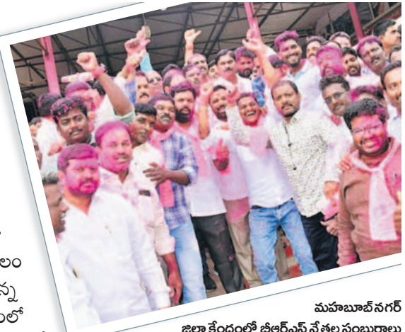
మహబూబ్ నగర్ జిల్లా కేంద్రంలో బీఆర్ఎస్ నేతల సంబురాలు

బీఆర్ఎస్ పార్టీ అధినేత, సీఎం కేసీఆర్ ఆదివారం ఎన్నికల మ్యానిఫెస్టో ప్రకటించారు. అందులో సంక్షేమానికి, పేదలకు అధిక ప్రాధాన్యతనిచ్చారు. రోజువారీ జనావసరాల్లో భాగమయ్యేలా రూపొందించిన మ్యానిఫెస్టో ప్రతిపక్షాలకు మైండ్ బ్లాంక్ అయ్యింది. ప్రజలు, దివ్యాంగులకు ఆర్థిక భరోసా కల్పించే ఆసరా పింఛన్ ను గణనీయంగా పెంచడం విశేషం. రేషన్ కార్డు లబ్ధిదారులందరికీ సన్నబీయ్యం అందించేందుకు 'అన్నపూర్ణ'ను ప్రవేశపెట్టారు. దేశంలో ఏ రాష్ట్రంలో లేని, ఏ పార్టీ ప్రవేశపెట్టని విధంగా ప్రజలందరికీ లబ్ధి చేకూరేలా ఈ పథకానికి శ్రీకారం చుట్టారు. 'కేసీఆర్ బీమా.. ప్రతి కుటుంబానికి ధీమా'తో రాష్ట్ర వ్యాప్తంగా 93 లక్షల కుటుంబాలకు లబ్ధి కలుగునున్నది. ఈ పథకం కింద కుటుంబంలో ప్రతిఒక్కరికీ రూ.5లక్షల బీమా సదుపాయం కల్పించింది. రైతుబంధు సాయాన్ని అధికారంలోకి వచ్చిన మొదటి ఏడాది రూ.12 వేలకు చేయనున్నది. వచ్చే ఐదేండ్లనాటికి రూ.16వేలకు చేరనున్నది. పేదలు, జర్నలిస్టులకు రూ.400