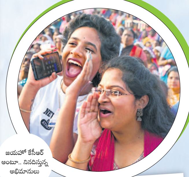
జయహో కేసీఆర్ అంటూ.. నినదస్తున్న ఆభిమానులు