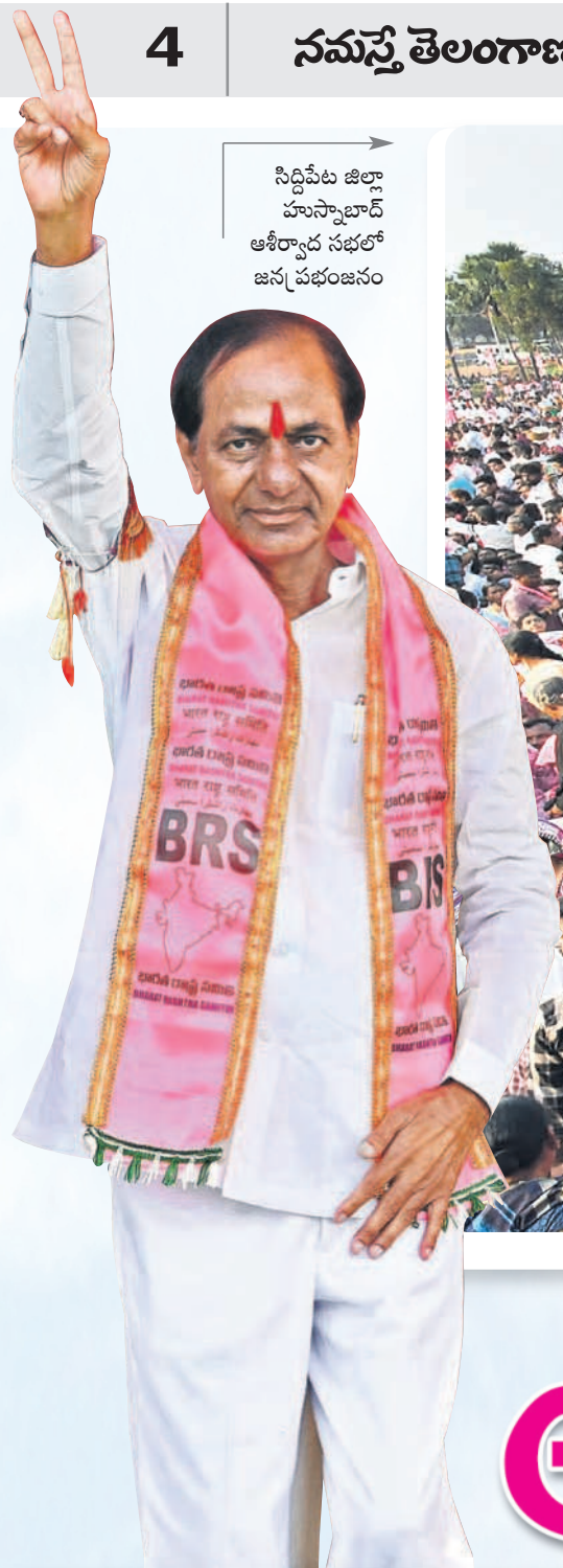
సిద్దిపేట జిల్లా హుస్సాబాద్ ప్రజా ఆశీర్వాద సభలో జనప్రభంజనం