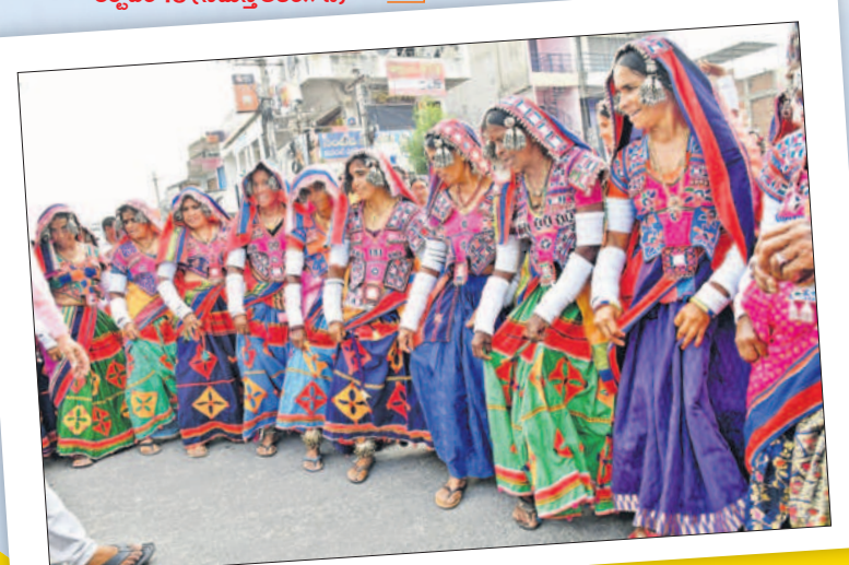
సృత్యం చేస్తున్న గిరిజనులు