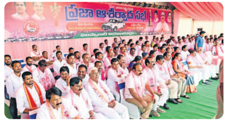
సభా వేదికపై మంత్రి హరీశ్ రావు, ఎమ్మీ కేశవరావు, మాజీ ఎమ్మీ కె.పెన్ లక్ష్మీకాంతరావు తదితరులు