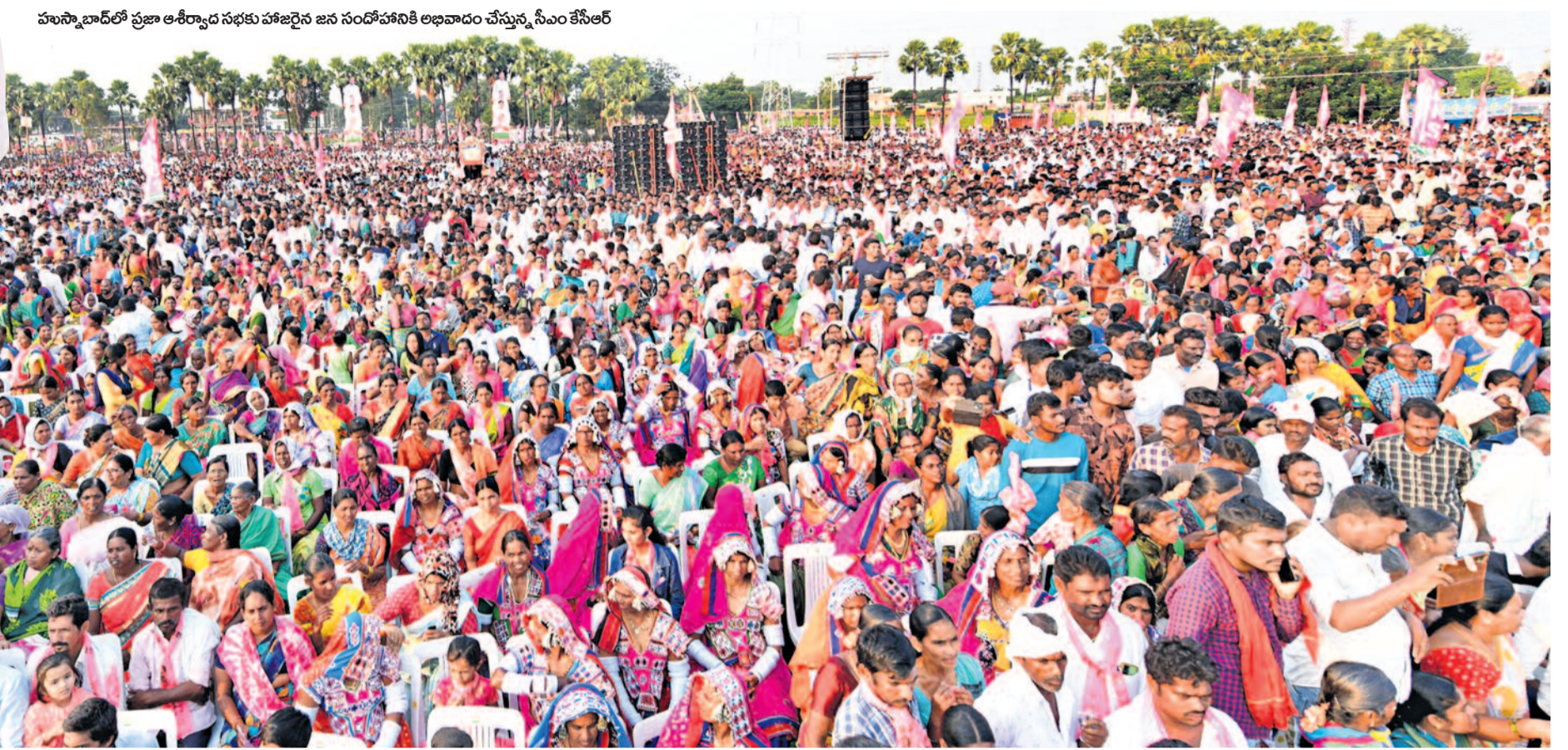
హుస్సూబాద్లో ప్రజా ఆశీర్వాద సభకు హాజరైన జన సందోహానికి అభివాదం చేస్తున్న సీఎం కేసీఆర్

సోమవారం MONDAY 16.10.2023 హైదరాబాద్ HYDERABAD పేజీలు: 16+8+16/12 Pages: 16+10+16/12 సంపుటి (Volume): 13 సంచిక (Issue): 132 || వెల (Price) రూ.6.50 PUBLISHED FROM HYDERABAD • KARIMNAGAR • WARANGAL • KHAMMAM • NALGONDA • MAHABUBNAGAR • NIZAMABAD www.ntnews.com ntdailyonline