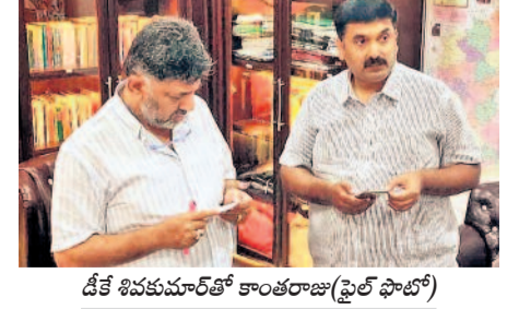
డీకే శివకుమార్ తో కాంతరాజు (ఫైల్ ఫోటో)

కర్ణాటకలో కాంగ్రెస్ నేతకు చెందిన నగదు పట్టివేత