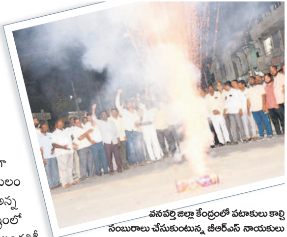
వనపర్తి జిల్లా కేంద్రంలో పటాకులు కాల్చి సంబురాలు చేసుకుంటున్న బీఆర్ఎస్ నాయకులు

బీఆర్ఎస్ పార్టీ అధినేత, సీఎం కేసీఆర్ ఆదివారం ఎన్నికల మ్యానిఫెస్టో ప్రకటించారు. అందులో సంక్షేమానికి, పేదలకు అధిక ప్రాధాన్యతనిచ్చారు. రోజువారీ జనావసరాల్లో భాగమయ్యేలా రూపొందించిన మ్యానిఫెస్టో ప్రతిపక్షాలకు మైండ్ బ్లాంక్ అయ్యింది. ప్రజలు, దివ్యాంగులకు ఆర్థిక భరోసా కల్పించే ఆసరా పింఛన్ ను గణనీయంగా పెంచడం విశేషం. రేషన్ కార్డు లబ్ధిదారులందరికీ సన్నబియ్యం అందించేందుకు 'అన్నపూర్ణ'ను ప్రవేశపెట్టారు. దేశంలో ఏ రాష్ట్రంలో లేని, ఏ పార్టీ ప్రవేశపెట్టని విధంగా ప్రజలందరికీ లబ్ధి చేకూరేలా ఈ పథకానికి శ్రీకారం చుట్టారు. 'కేసీఆర్ బీమా.. ప్రతి కుటుంబానికి ధీమా'తో రాష్ట్ర వ్యాప్తంగా 93 లక్షల కుటుంబాలకు లబ్ధి కలుగునున్నది. ఈ పథకం కింద కుటుంబంలో ప్రతిఒక్కరికీ రూ.5లక్షల బీమా సదుపాయం కల్పించింది. రైతుబంధు సాయాన్ని అధికారంలోకి వచ్చిన మొదటి ఏడాది రూ.12 వేలకు చేయనున్నది. వచ్చే ఐదేండ్లనాటికి రూ.16వేలకు చేరనున్నది. పేదలు, జర్నలిస్టులకు రూ.400