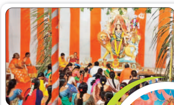
కొల్లాపూర్ లో పూజలు చేస్తున్న భక్తులు

కొల్లాపూర్, అక్టోబర్ 15 : పట్టణంలో వరిదేల శ్రీమీపుక్ష ఉత్సవ అభివృద్ధి కమిటీ ఆధ్వర్యంలో దుర్గాదేవీ శరన్నవరాత్రి ఉత్సవాల్లో భాగంగా 13వ వార్షికోత్సవం ఆదివారం తొలిరోజున బాల త్రిపుర సుందరీదేవీ అలంకరణలో అమ్మవారు భక్తులకు దర్శనమిచ్చారు. అమ్మవారిని అర్చకుల వేదామంత్రోచ్ఛరణలతో ప్రతిష్ఠించారు. భక్తులు అమ్మవారికి దీపారాధన చేశారు.