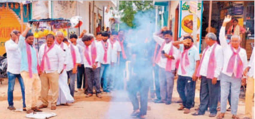
పెంట్లవెల్లిలో పటాకులు పేలుస్తున్న బీఆర్ఎస్ నాయకులు