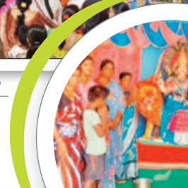
చిన్నంబావి : అమ్మాయిపల్లిలో అమ్మవారు..

వీపనగండ్ల, అక్టోబర్ 15 : మండల కేంద్రంతో పాటు తూంకుంట, గోవర్ధన గిరి గ్రామాల్లో దుర్గాదేవీ మండపాలు ఏర్పాటు చేసి భక్తులు ప్రత్యేక పూజలు నిర్వహించారు. తొమ్మిది రోజుల పాటు అమ్మవారికి వివిధ రూపాల్లో ప్రత్యేక పూజలు నిర్వహిస్తారని తెలిపారు.