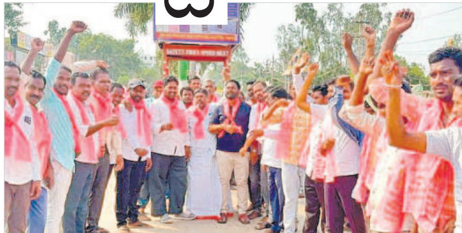
నాగర్ కర్నూల్ లో హర్షం వ్యక్తం చేస్తున్న బీఆర్ఎస్ శ్రేణులు

సీఎం, బీఆర్ఎస్ అధినేత కేసీఆర్ ప్రకటించిన 2023 అసెంబ్లీ ఎన్నికల మ్యానిఫెస్టో ప్రజలను ఎంతగానో ఆకట్టుకొంది. పేదల సంక్షేమమే లక్ష్యంగా రూపొందించడంపై ప్రజలతోపాటుగా మేధావుల్లోనూ చర్చనీయాంశంగా మారింది. తెలంగాణ ఏర్పడినప్పటి నుంచి పేదరికం దూరం చేసే పేదల ఆర్థిక జీవితాల్లో మార్పు తీసుకురావడమే లక్ష్యంగా సీఎం కేసీఆర్ పథకాలను అమలు చేస్తూ వస్తున్నారు. ఈ క్రమంలో రాబోయే అసెంబ్లీ ఎన్నికల్లోనూ పేదల సంక్షేమానికే ప్రాధాన్యత ఇస్తూ మ్యానిఫెస్టోను ప్రకటించడం విశేషం. ముఖ్యంగా పేదలకు ఆర్థిక భరోసా కల్పించే ఆసరా పంచన రూ.2,016 నుంచి రూ.6,016కు పెంచడం విశేషం. ఈ ఎన్నికల్లో అధికారంలోకి వచ్చిన మొదటి ఏడాది రూ.2,016 ఆసరా పంచన రూ.3,016 కు పెంచడం జరుగుతుంది. ఆ తర్వాత వచ్చే ఐదేండ్లలో రూ.5,106కు చేరు