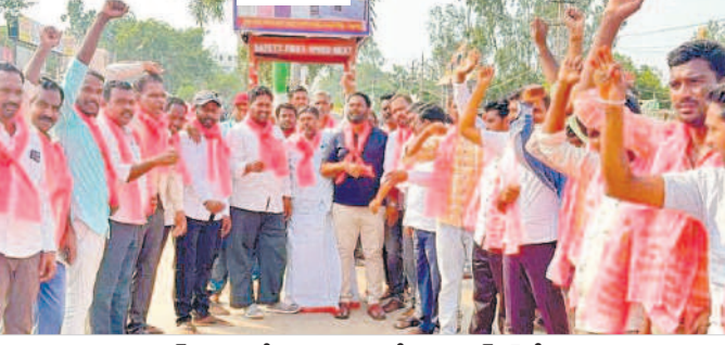
నాగర్ కర్నూల్లో హర్షం వ్యక్తం చేస్తున్న బీఆర్ఎస్ శ్రేణులు

పేదల మ్యానిఫెస్టో.. సీఎం, బీఆర్ఎస్ అధినేత కేసీఆర్ ప్రకటించిన 2023 అసెంబ్లీ ఎన్నికల మ్యానిఫెస్టో ప్రజలను ఎంతగానో ఆకట్టుకొంది. పేదల సంక్షేమమే లక్ష్యంగా రూపొందించడంపై ప్రజలతోపాటుగా మేధావుల్లోనూ చర్చనీయాంశంగా మారింది. తెలంగాణ ఏర్పడినప్పటి నుంచి పేదరికం దూరం చేసే పేదల ఆర్థిక జీవితాల్లో మార్పు తీసుకురావడమే లక్ష్యంగా సీఎం కేసీఆర్ పథకాలను అమలు చేస్తూ వస్తున్నారు. ఈ క్రమంలో రాబోయే అసెంబ్లీ ఎన్నికల్లోనూ పేదల సంక్షేమానికే ప్రాధాన్యత ఇస్తూ మ్యానిఫెస్టోను ప్రకటించడం విశేషం. ముఖ్యంగా పేదలకు ఆర్థిక భరోసా కల్పించే ఆసరా పంచన రూ.2,016 నుంచి రూ.6,016కు పెంచడం విశేషం. ఈ ఎన్నికల్లో అధికారంలోకి వచ్చిన మొదటి ఏడాది రూ.2,016 ఆసరా పంచన రూ.3,016 కు పెంచడం జరుగుతుంది. ఆ తర్వాత వచ్చే ఐదేండ్లలో రూ.5,106కు చేరు