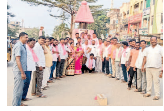
నర్సంపేటలో సంబురాలు చేసుకుంటున్న బీఆర్ఎస్ శ్రేణులు

పెన్షన్లు పెంచడం, రైతు బంధు కింద పెట్టుబడి సాయాన్ని పెంచుతామని పేర్కొనడంపై ఆయా వర్గాలు సంతోషం వ్యక్తం చేస్తున్నాయి. అర్హులైన మహిళలకు ప్రతి నెల రూ.3 వేల చొప్పున భృతి, పేద మహిళలకు రూ.400కు గ్యాస్ సిలిండర్, మహిళా సమాఖ్యలకు సొంత భవనాలు నిర్మించనున్నట్లు మేనిఫెస్టోలో పేర్కొనడంపై నాలోకించే వేనోళ్ల పొరుగుతున్నది. ఆరోగ్యశ్రీ కింద వైద్యం కోసం అందించే మొత్తాన్ని రూ.5 లక్షల నుంచి రూ.15 లక్షలకు పెంచడం, అగ్రవర్గాల్లోని పేద పిల్లల చదువుల కోసం నియోజకవర్గానికో గురుకులాన్ని నెలకొల్పడం, ఉద్యోగుల సీపీఎన్ఎస్ అధ్యయన కమిటీని నియమించుకున్నట్లు తెలపడంతో హర్షం వ్యక్తం చేస్తున్నది. అన్ని వర్గాలకు మరింత తోడ్పాటు అందించేలా ఉండడంతో సర్వత్రా చర్చ జరుగుతున్నది. మేనిఫెస్టోపై బీఆర్ఎస్ పార్టీ శ్రేణులు ఉమ్మడి జిల్లా వ్యాప్తంగా సంబురాలు నిర్వహించారు. ప్రధాన కూడళ్ల వద్ద పటాకులు కాలారు. దీనిని చిహ్నంగా ర్యాలీలు తీశారు. ఊరూరా, వాడవాడనూ బీఆర్ఎస్ నకు అనుకూలంగా నినాదాలు చేశారు.