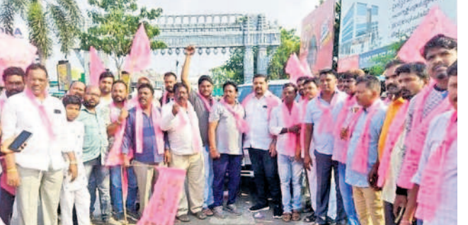
కాజీపేట పోలీస్టాలో సంబురాలు జరుపుకుంటున్న గులాబీ శ్రేణులు