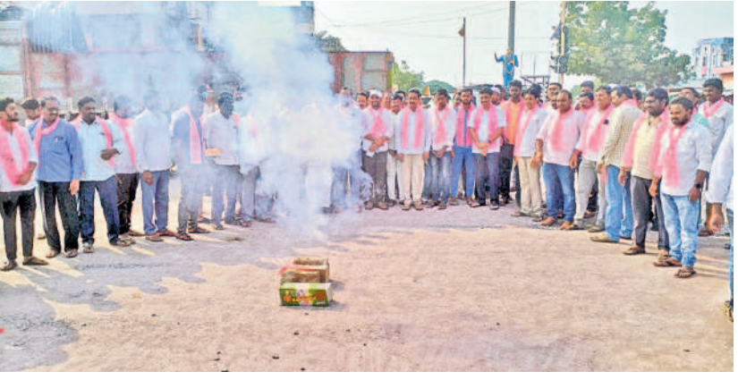
భూపాలపల్లి జిల్లా కేంద్రంలో పటాకులు కాల్చి సంబురాలు జరుపుతున్న బీఆర్ఎస్ నాయకులు