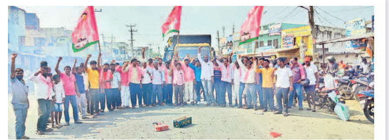
దంతాలపల్లిలో పటాకులు కాలుస్తున్న బీఆర్ఎస్ పార్టీ నాయకులు

మహిళాబాబాద్, అక్టోబర్ 15 (నమస్తే తెలంగాణ) : భారత రాష్ట్ర సమితి మేనిఫెస్టోను సర్వత్రా హర్షం వ్యక్తం చేస్తున్నది. అన్ని వర్గాల వారిని సంతృప్తి పరిచేలా ఉండని విశేషాలు అభిప్రాయ పడుతున్నాడు. ఆదాయం పెంచాలి.. పేదలకు వంపాలనే విధానంతో తొమ్మిదన్నరేండ్లుగా పాలన సాగిస్తున్న బీఆర్ఎస్ ప్రభుత్వం సంక్షేమ పథకాల అమలులో దేశంలోనే నంబర్ వన్ గా నిలిచింది. మన నిధులు మనకే అనే నినాదాన్ని పూర్తి స్థాయిలో అమలు చేస్తూ రాష్ట్రంలోని ప్రతి ఊరును, బస్టిని సమగ్రంగా అభివృద్ధి చేసింది. ఇప్పటి వరకు జరిగిన అభివృద్ధికి కొనసాగింపుగా సంక్షేమ పథకాలను మరింత విస్తృతం చేస్తూ బీఆర్ఎస్ అధినేత కేసీఆర్ పార్టీ మేనిఫెస్టోను ప్రకటించారు. దీన్ని ముఖ్యంగా పేదలు, మహిళలు పూర్తి స్థాయిలో స్వాగతిస్తున్నారు. రాష్ట్రంలోని ప్రతి పేద కుటుంబానికీ రేషన్ షాపుల ద్వారా సన్న బియ్యం ఇస్తామన నడం, తెల్లకార్డు ఉన్న ప్రతి కుటుంబానికీ రూ.5 లక్షల బీమా అమలు చేస్తామనడంపై పేద వర్గాలు సంతృప్తి వ్యక్తం చేస్తున్నాయి. వృద్ధాప్య, దివ్యాంగ