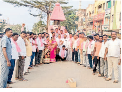
నర్సంపేటలో సంబురాలు చేసుకుంటున్న బీఆర్ఎస్ శ్రేణులు