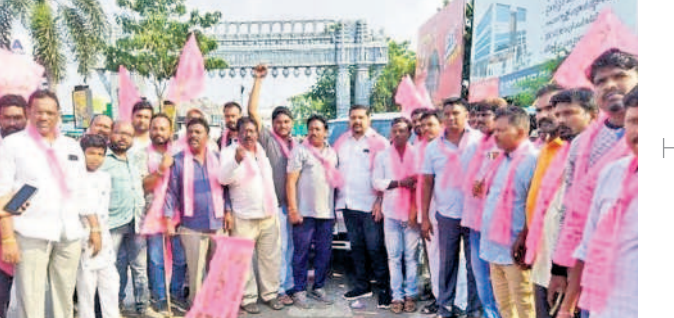
కాజీపేట పోలీస్ స్టేషన్లో సంబురాలు జరుపుకుంటున్న గులాబీ శ్రేణులు