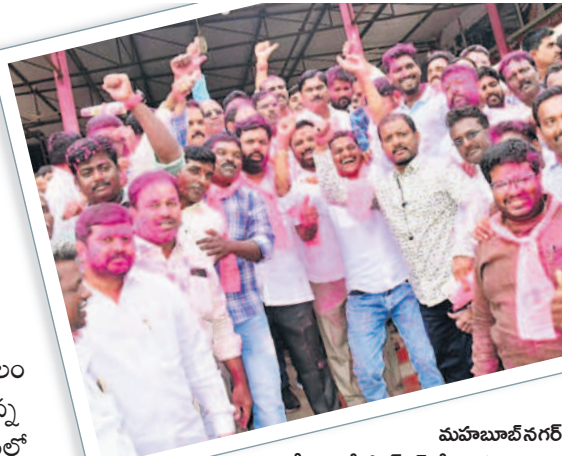
మహబూబ్ నగర్ జిల్లా కేంద్రంలో బీఆర్ఎస్ నేతల సంబురాలు

బీఆర్ఎస్ పార్టీ అధినేత, సీఎం కేసీఆర్ ఆదివారం ఎన్నికల మ్యానిఫెస్టో ప్రకటించారు. అందులో సంక్షేమానికి, పేదలకు అధిక ప్రాధాన్యతనిచ్చారు. రోజువారీ జనావసరల్లో భాగమయ్యేలా రూపొందించిన మ్యానిఫెస్టో ప్రతిపక్షాలకు మైండ్ బ్లాంక్ అయ్యింది. ప్రజలు, దివ్యాంగులకు ఆర్థిక భరోసా కల్పించే ఆసరా పింఛన్ ను గణనీయంగా పెంచడం విశేషం. రేషన్ కార్డు లబ్ధిదారులందరికీ సన్నబియ్యం అందించేందుకు 'అన్నపూర్ణ'ను ప్రవేశపెట్టారు. దేశంలో ఏ రాష్ట్రంలో లేని, ఏ పార్టీ ప్రవేశపెట్టని విధంగా ప్రజలందరికీ లబ్ధి చేకూరేలా ఈ పథకానికి శ్రీకారం చుట్టారు. 'కేసీఆర్ బీమా.. ప్రతి కుటుంబానికి ధీమా'తో రాష్ట్ర వ్యాప్తంగా 93 లక్షల కుటుంబాలకు లబ్ధి కలుగునున్నది. ఈ పథకం కింద కుటుంబంలో ప్రతిఒక్కరికీ రూ.5లక్షల బీమా సదుపాయం కల్పించింది. రైతుబంధు సాయాన్ని అధికారంలోకి వచ్చిన మొదటి ఏడాది రూ.12 వేలకు చేయనున్నది. వచ్చే ఐదేండ్లనాటికి రూ.16వేలకు చేరనున్నది. పేదలు, జర్నలిస్టులకు రూ.400